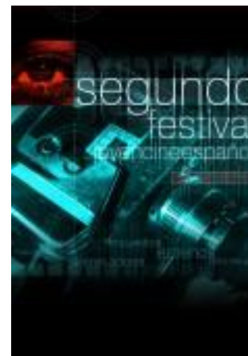
Exposición en la Casa de la Cultura de Fuentealbilla