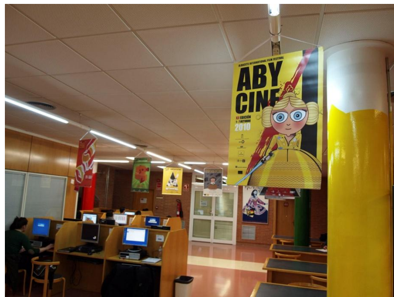
Carteles de Abycine expuestos en la biblioteca de la Universidad