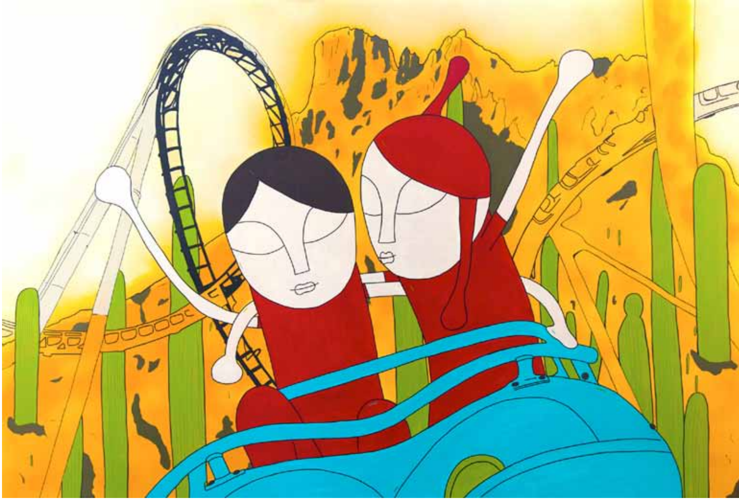
Montaña rusa. Serie. Parques de atracciones alrededor del mundo. Acrílico 80 x 120