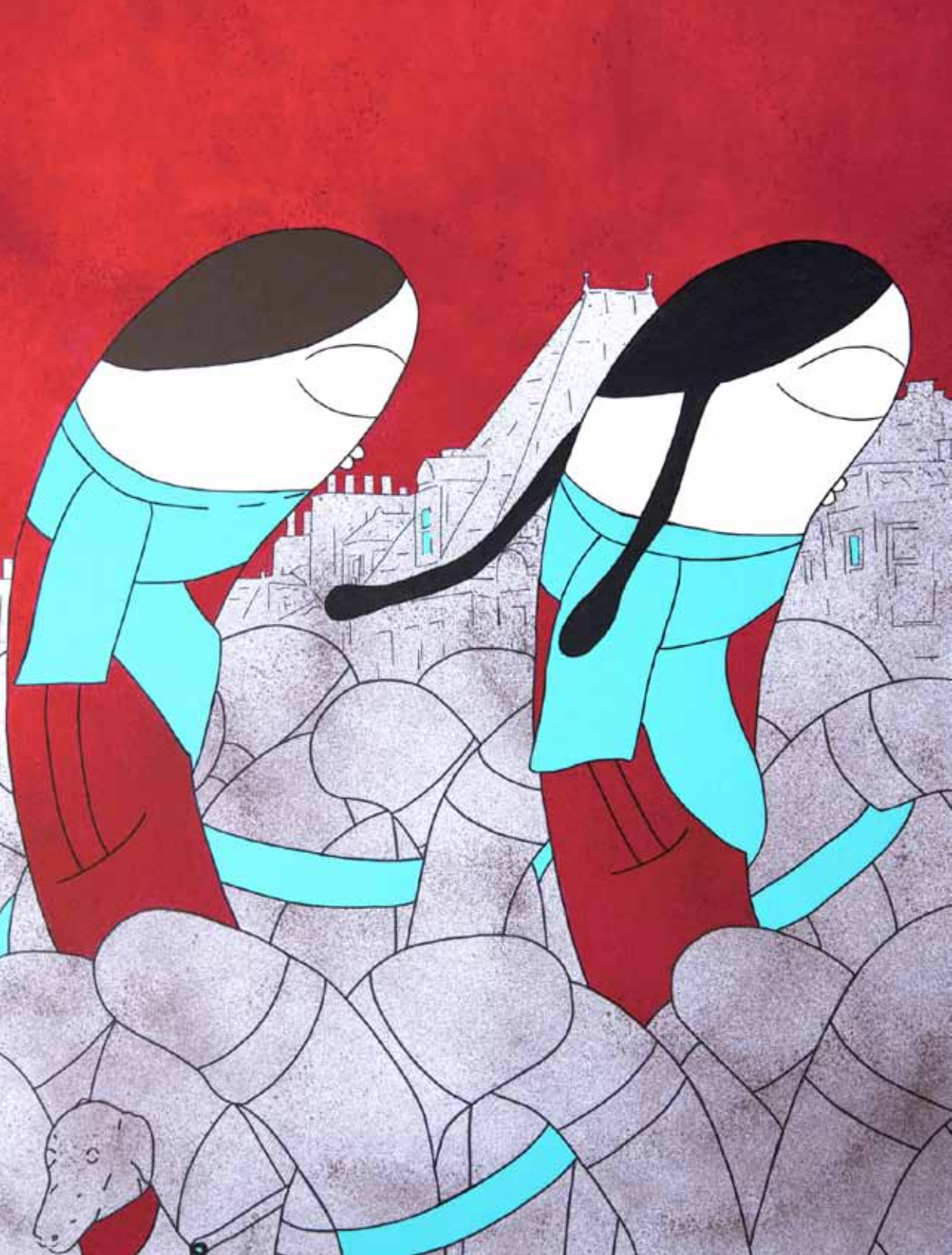
Bufanda para dos. Serie. Multitud. Acrílico 80 x 60