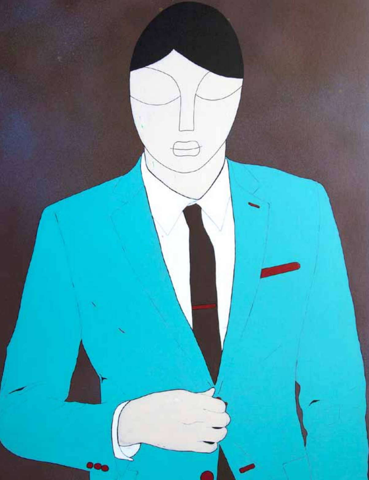
Botón. Serie. Daguerrotipo. Acrílico 80 x 60