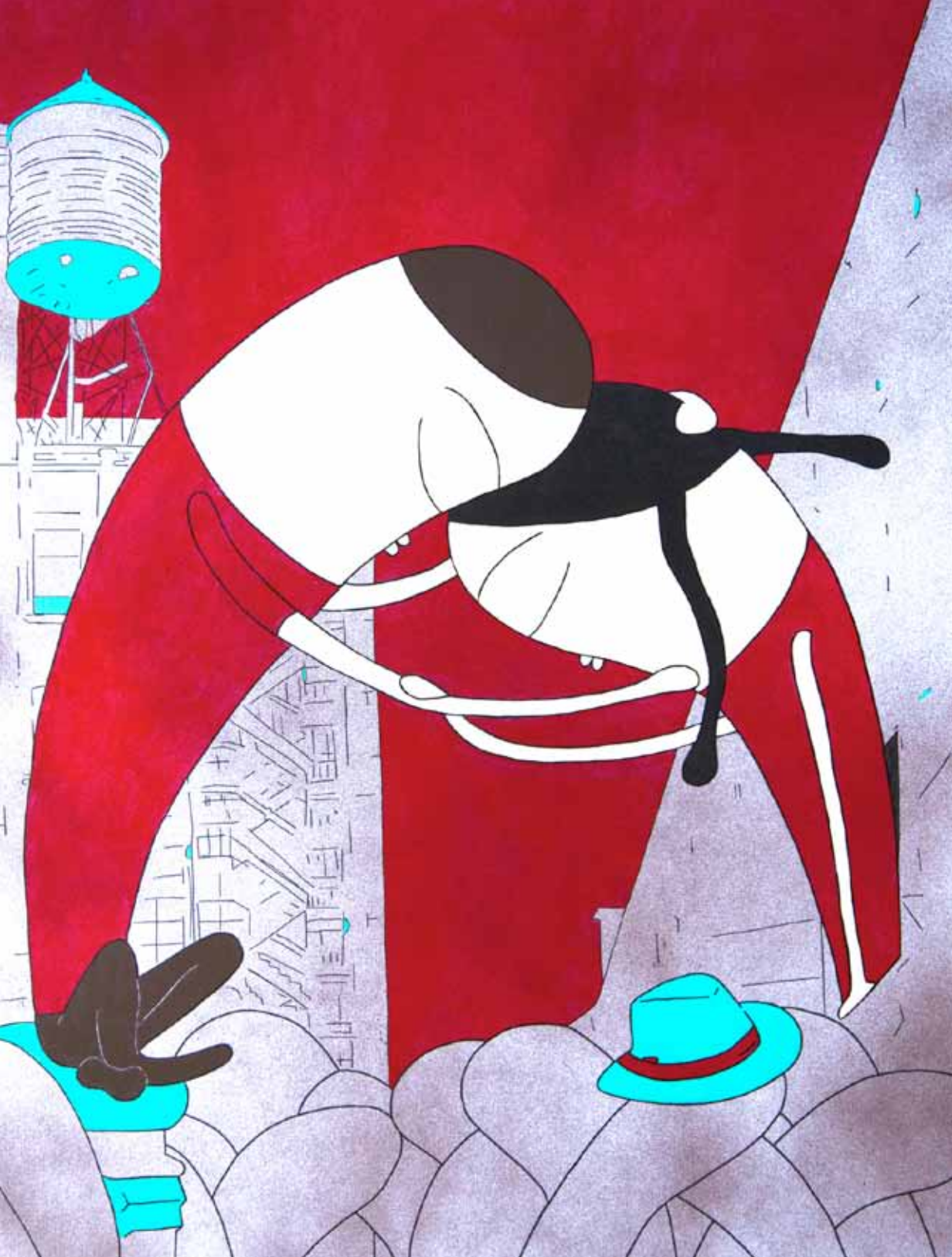
Paquete postal. Serie. Multitud. Acrílico 80 x 60