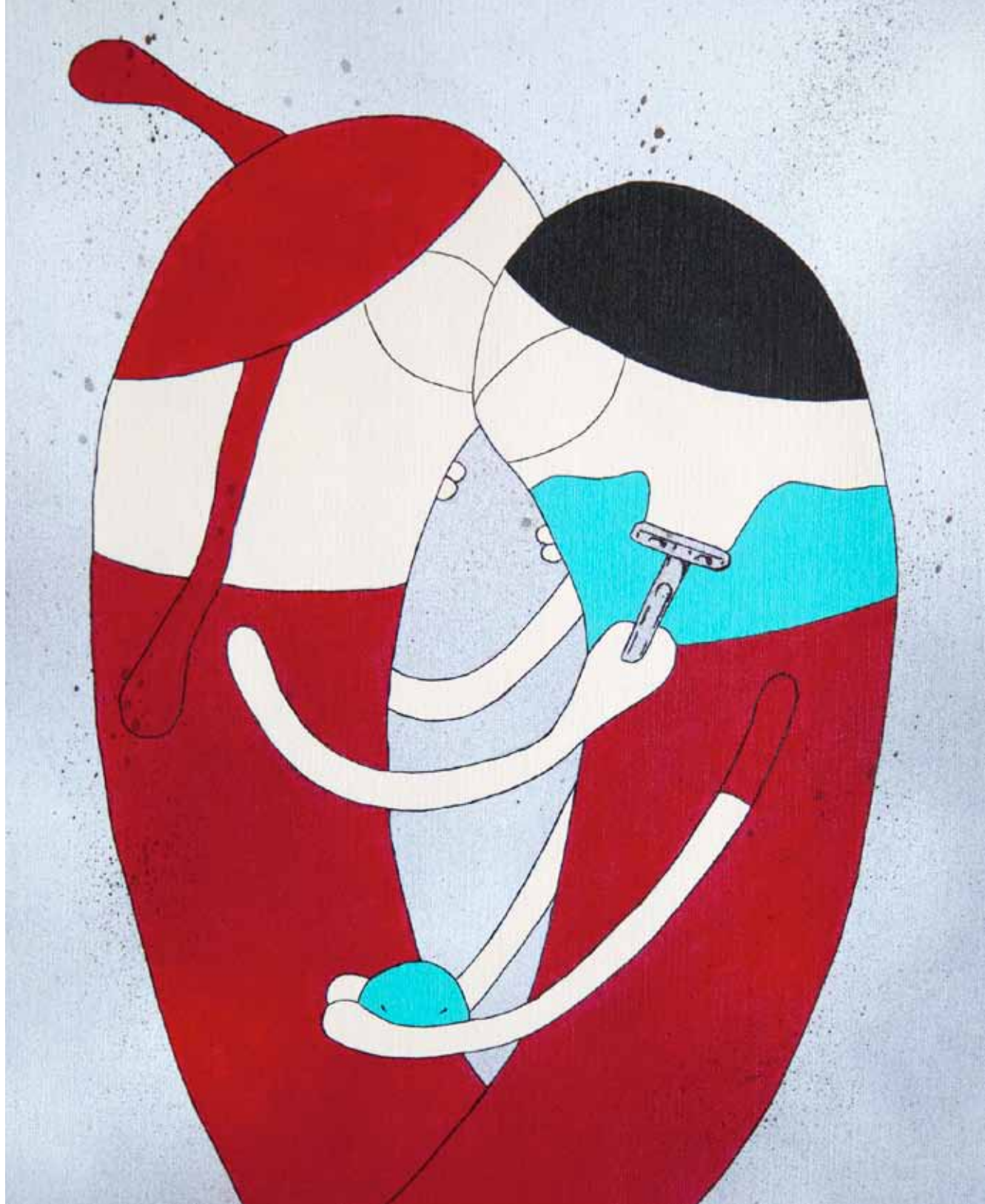
Afeitarse. Serie. Entre dos. Acrílico 41 x 33