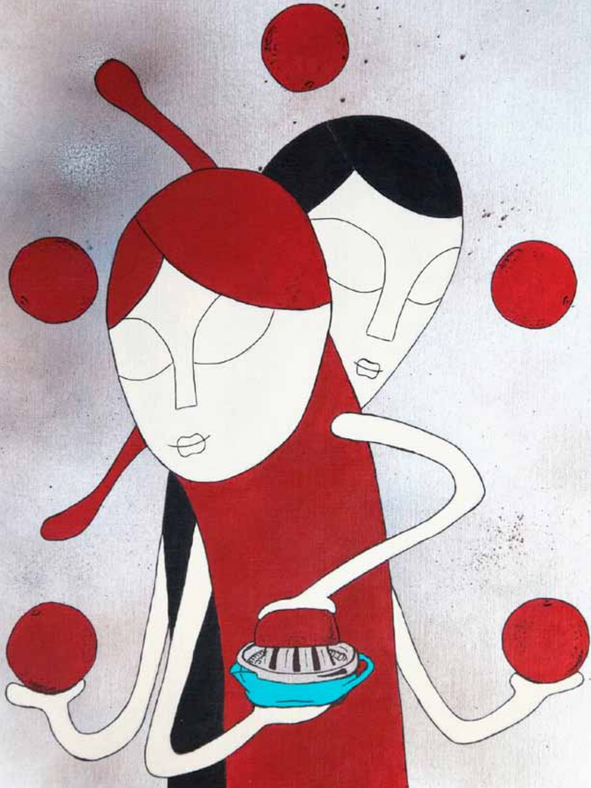
Naranjas. Serie. Entre dos. Acrílico 41 x 33