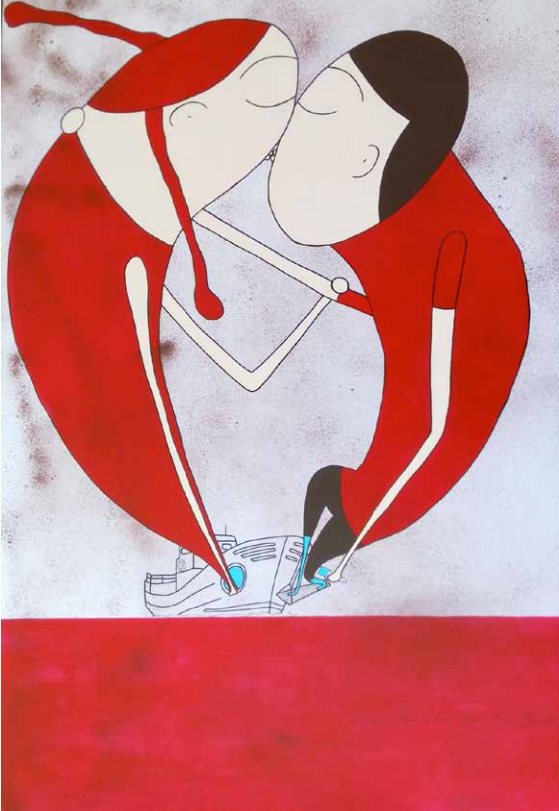
Amor salado (in the boat). Serie. Besos. Acrílico 120 x 80