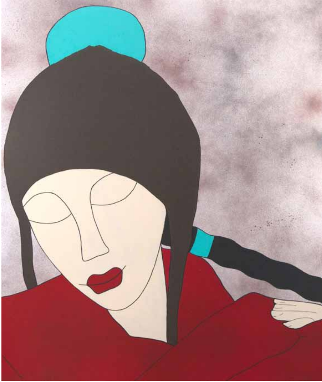
Ella en invierno. Serie. Las cuatro estaciones. Acrílico 95 x 80