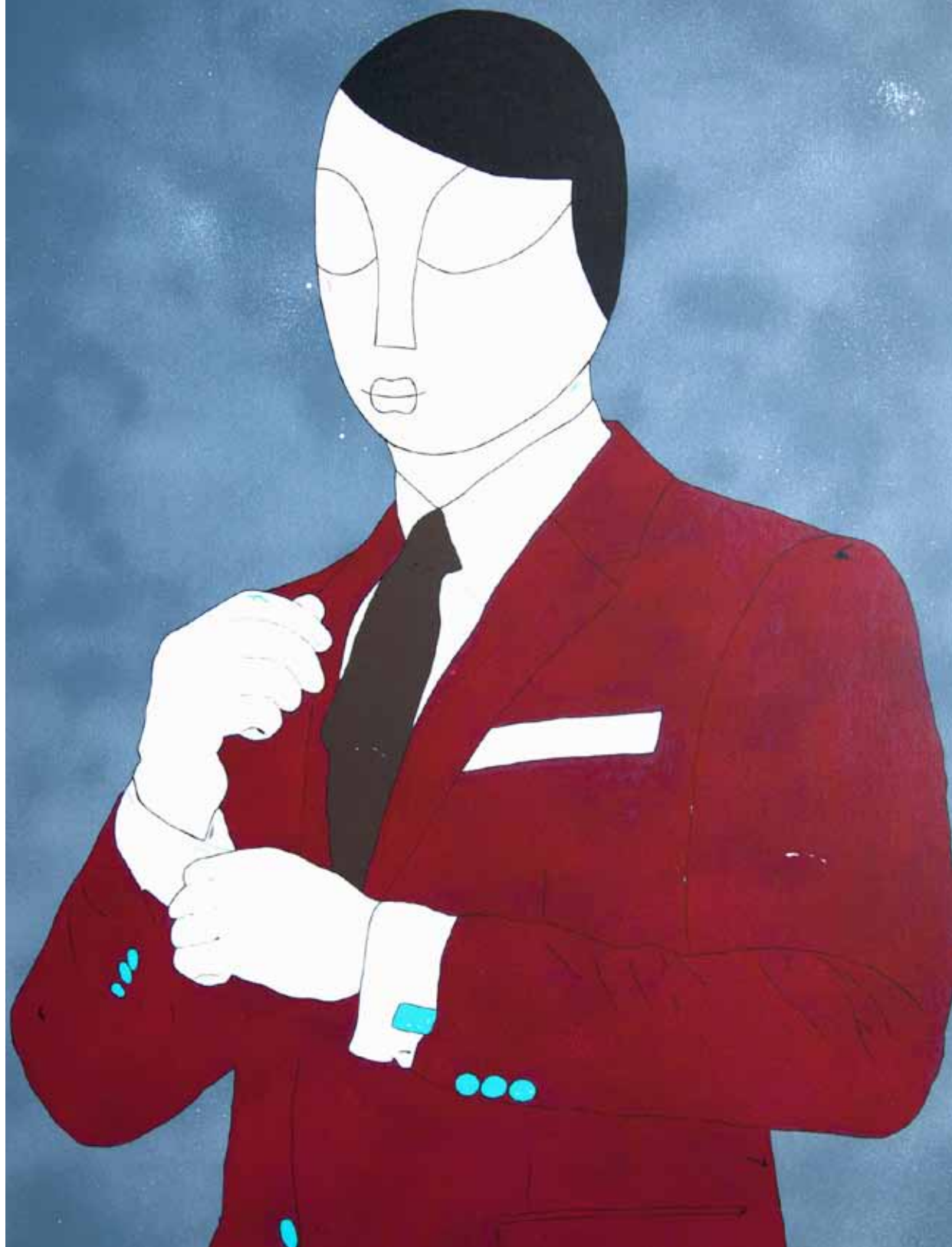
Gemeios. Serie. Daguerrotipo. Acrílico 80 x 60