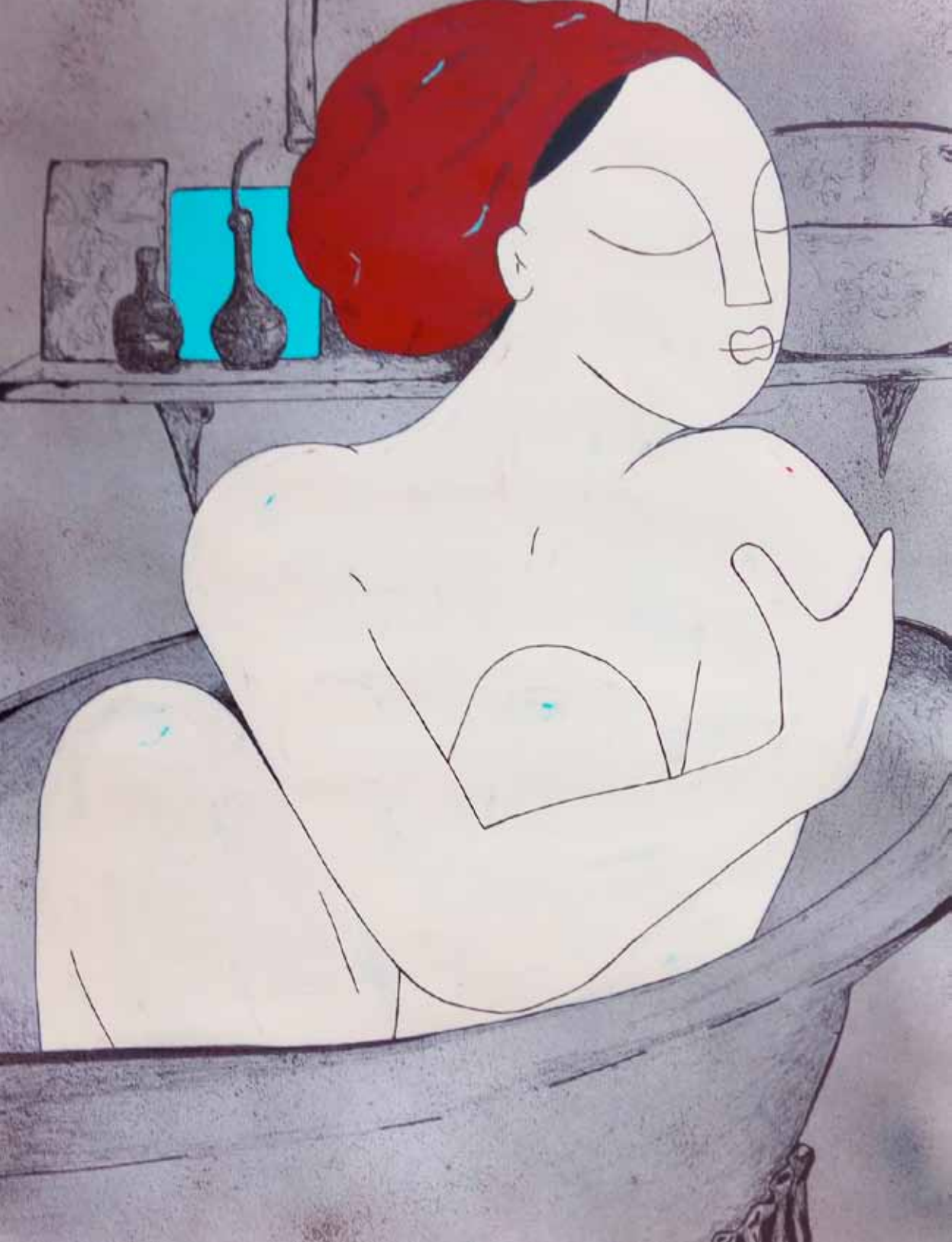
Baño. Serie. Hogar dulce hogar. Acrílico 56 x 42