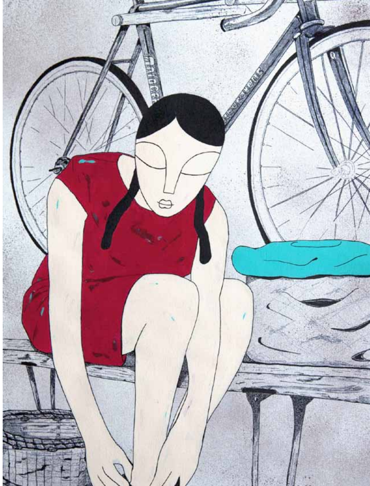
Vestíbulo. Serie. Hogar dulce hogar. Acrílico 56 x 42