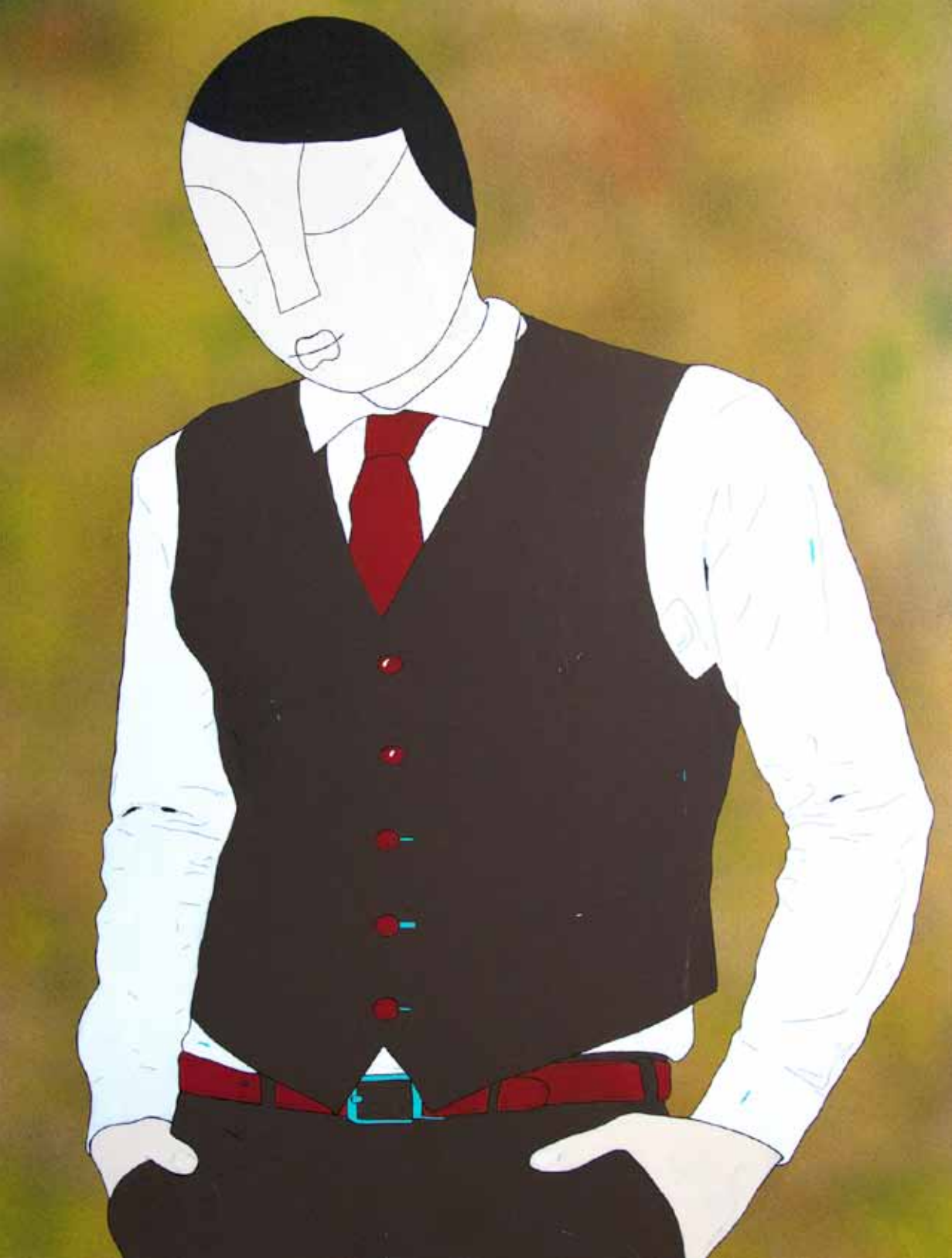
Chaleco. Serie. Daguerrotipo. Acrílico 80 x 60