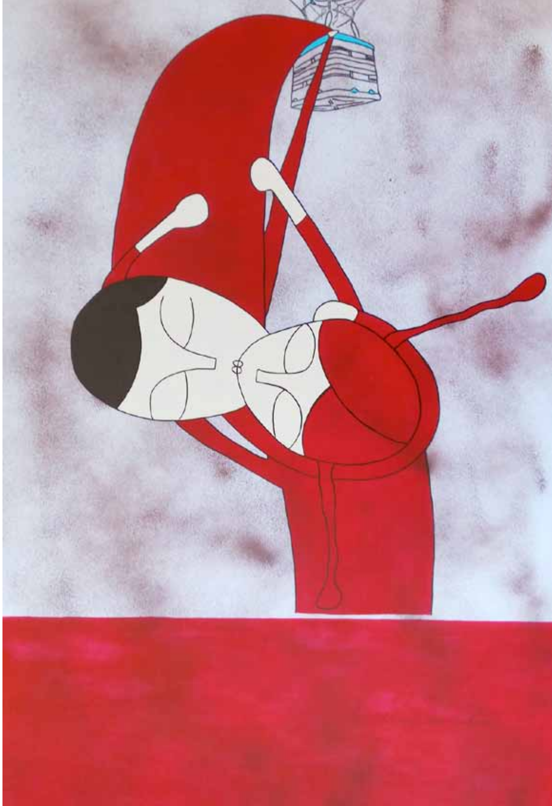
Me llevas de cabeza. Serie. Besos. Acrílico 120 x 80