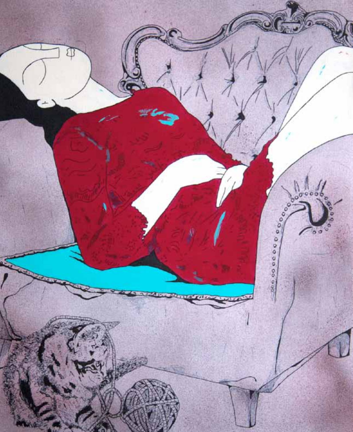
Salón. Serie. Hogar dulce hogar. Acrílico 56 x 42