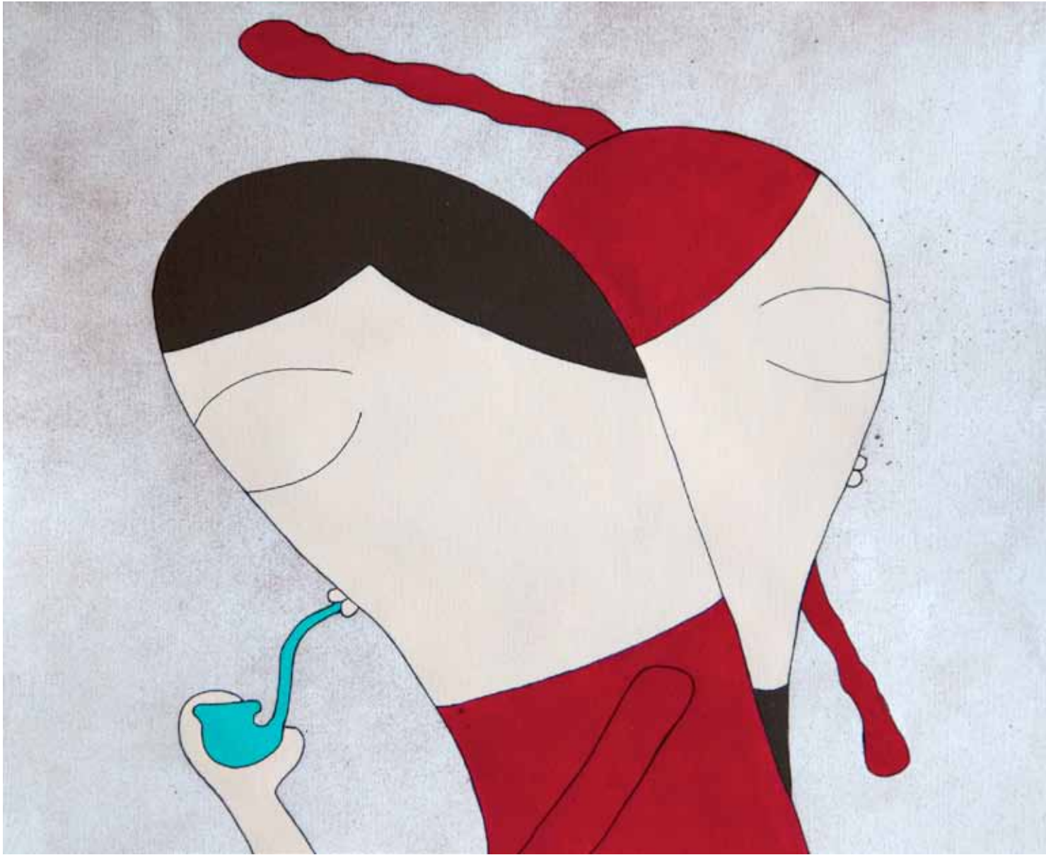
Pipa. Serie. Génesis. Acrílico 33 x 41