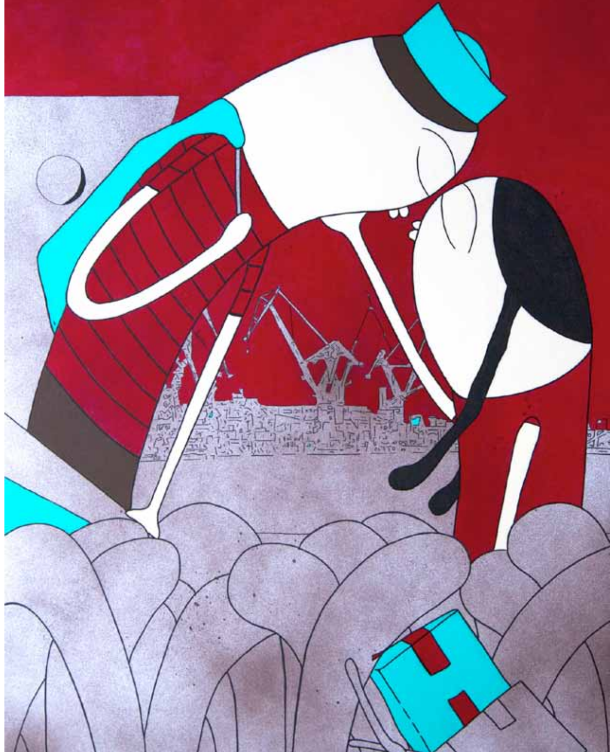
Marinero de agua salada. Serie. Multitud. Acrílico 80 x 60