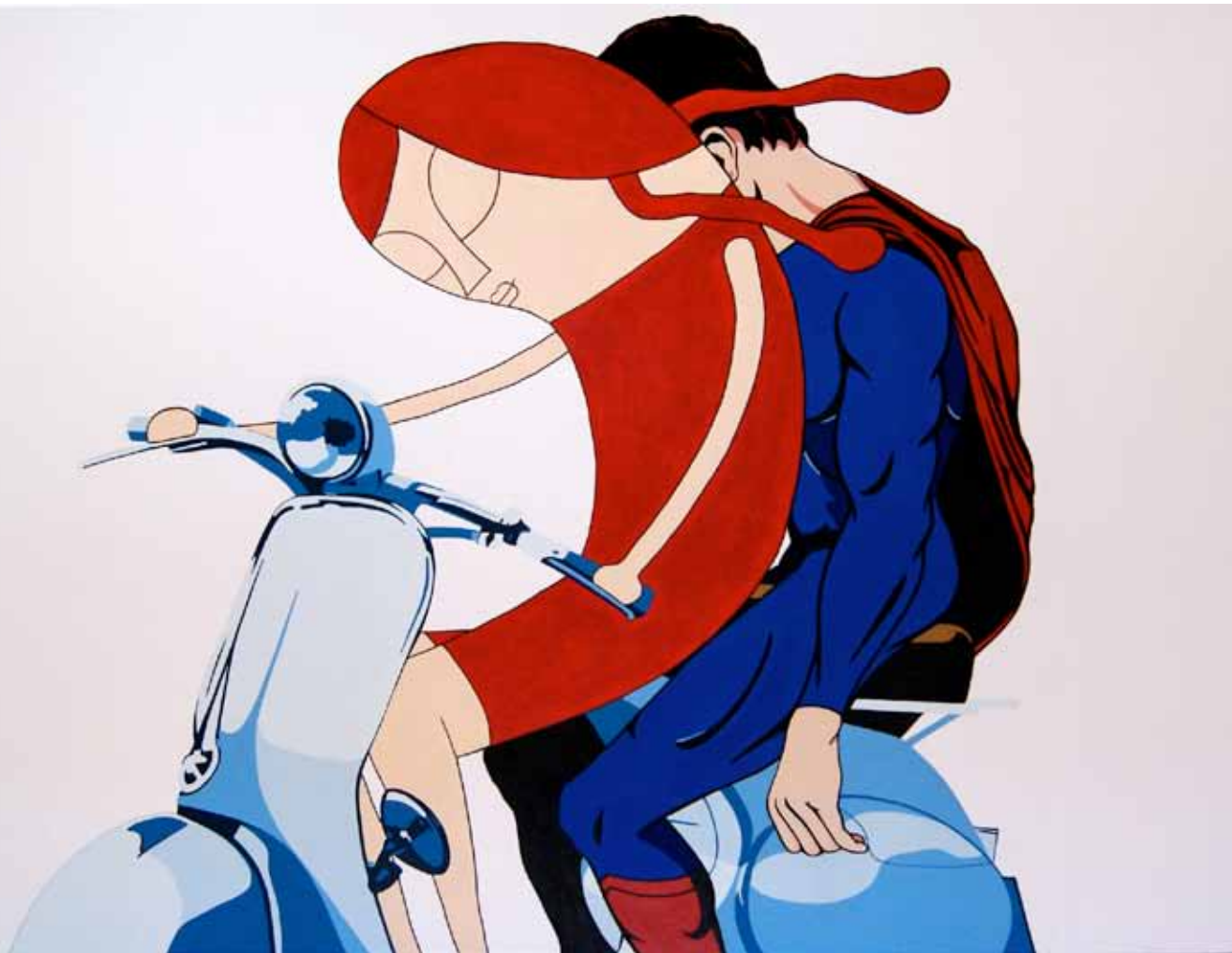
El día que Superman sufrió un ataque de kryptonita y me pidió que lo llevara a casa. Diálogo con Kike Chumillas. Artista plástico . Serie. A cuatro manos. Acrílico 80 x 120