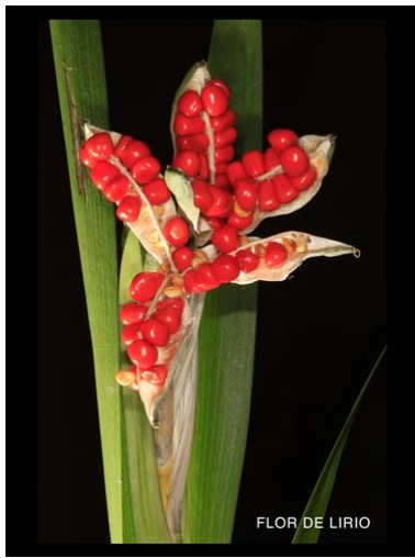
FLOR DE LIRIO