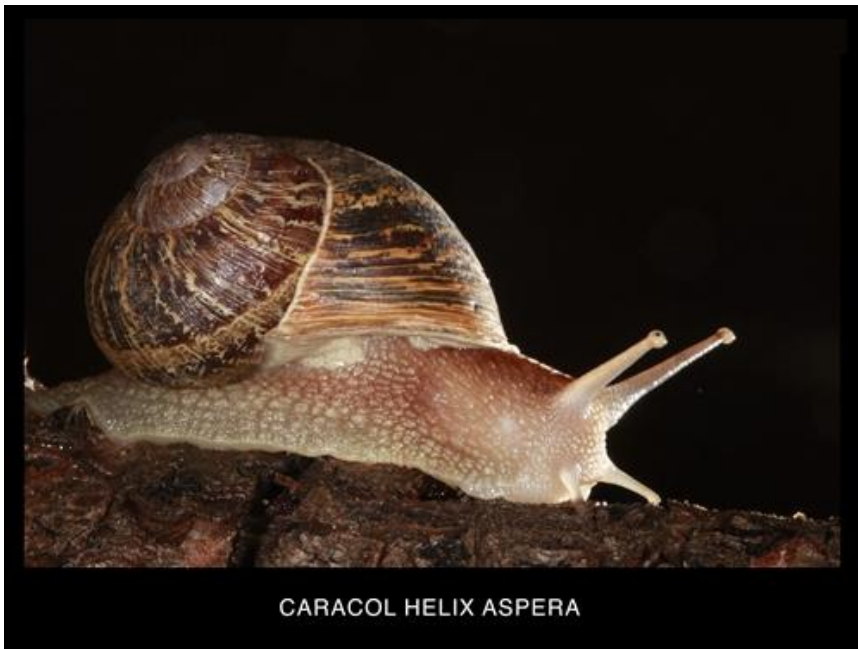
CARACOL HELIX ASPERA