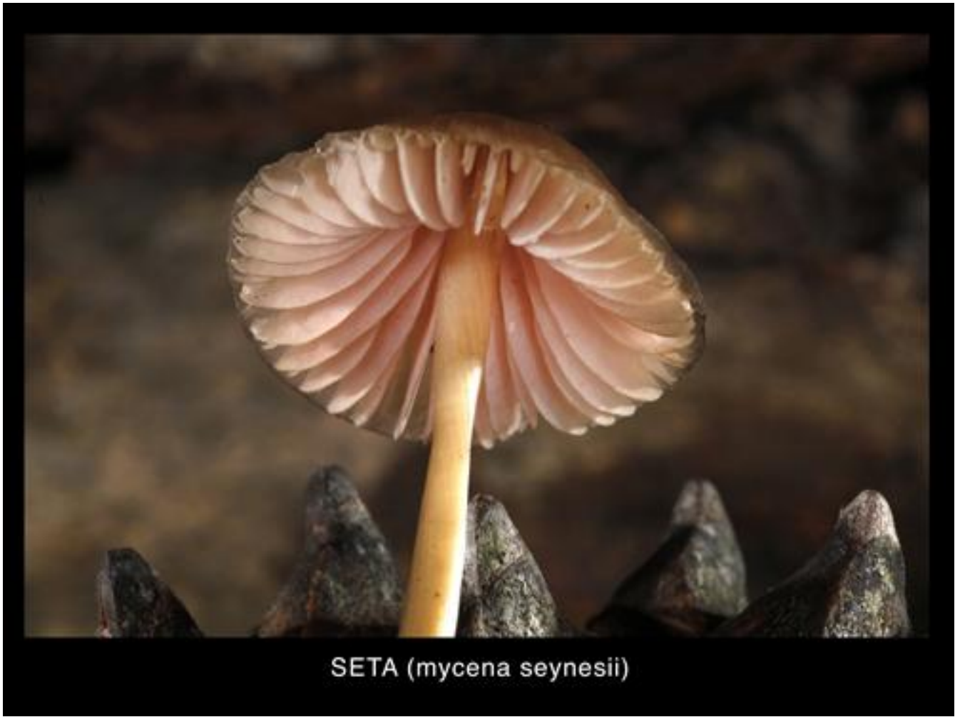
SETA ( mycena seynesii )