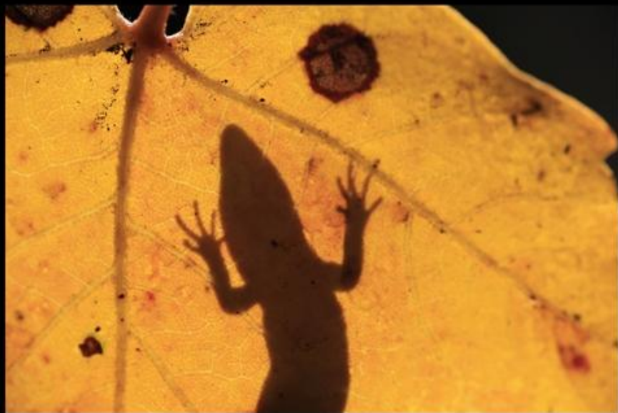
LAGARTIJA A CONTRALUZ