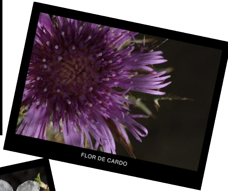
FLOR DE CARDO