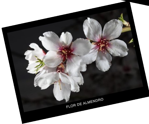
FLOR DE ALMENDRO