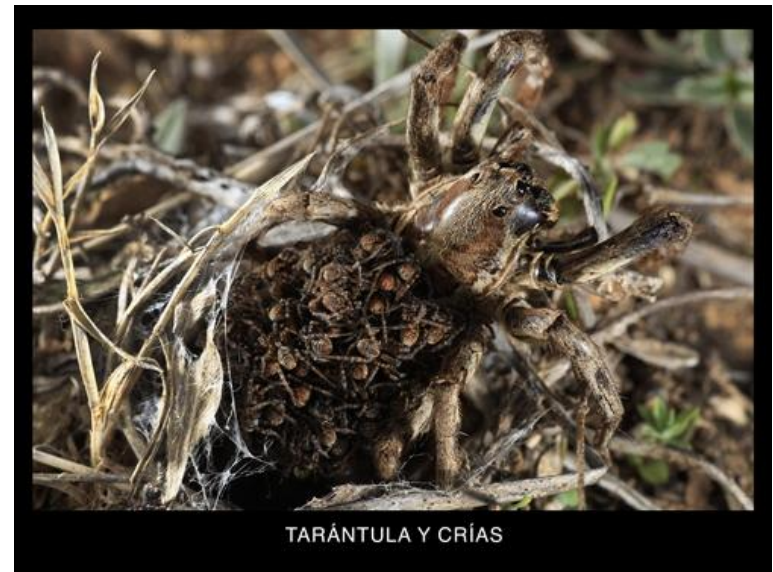
TARÁNTULA Y CRIAS