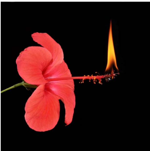
ESPECIE: Ibisco Iluminado LUGAR DE RECOLECCIÓN: Uruguay

Esta es una muestra de las imágenes que constituyen el proyecto, se pueden ver más y ampliar información en el blog: http://trans-mutaciones.blogspot.com/