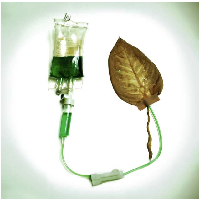
ESPECIE: Sobreviviré RECOLECTORA: Maritype LUGAR DE RECOLECCIÓN: Fast Food Clorofilium FECHA: 02-02-2009