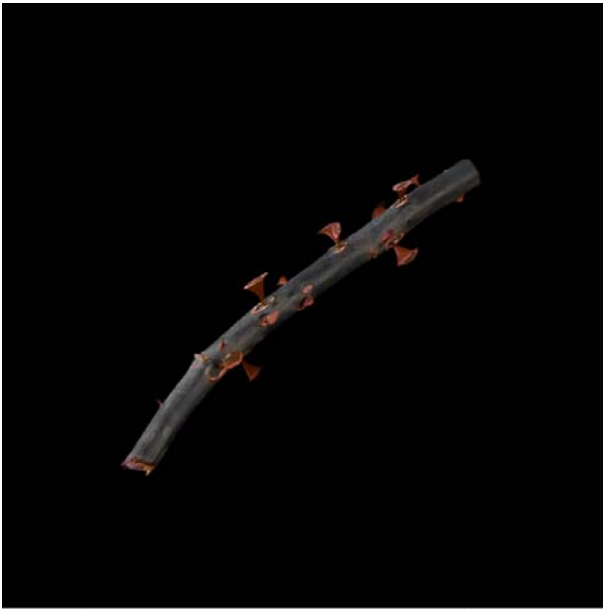
ESPECIE: Rosa Culpae (esqueje) LUGAR DE RECOLECCIÓN: Teruel