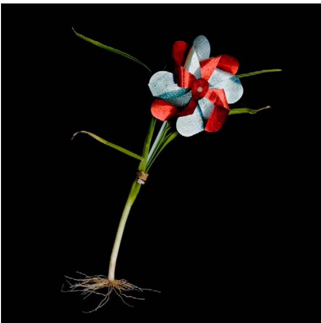
ESPECIE: Ecomercadea novilis LUGAR DE RECOLECCIÓN: Bosque Animado de Cecebre Cambre (A Coruña)