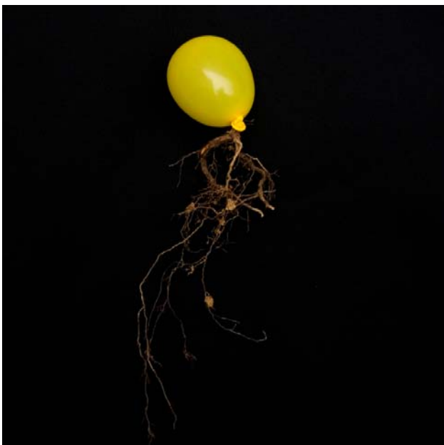
ESPECIE: Globus amarillentus LUGAR DE RECOLECCIÓN: Sege (Albacete)