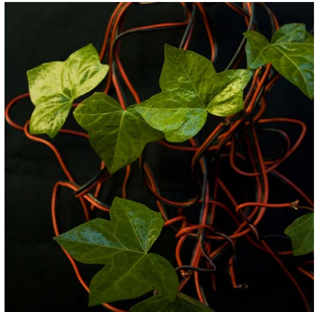
ESPECIE: Eléctrica Enredadera. LUGAR DE RECOLECCIÓN: Albacete.