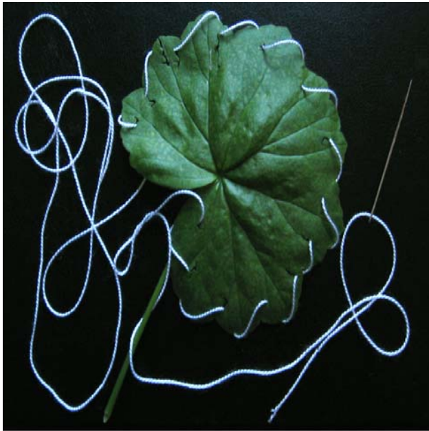
ESPECIE: Pespunte natural LUGAR DE RECOLECCIÓN: Albacete