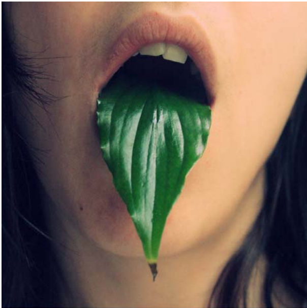
ESPECIE: Spathiphyllum LUGAR DE RECOLECCIÓN: Albacete