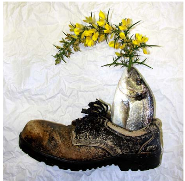
ESPECIE: doraDADA LUGAR DE RECOLECCIÓN: Ribeira (A Coruña)