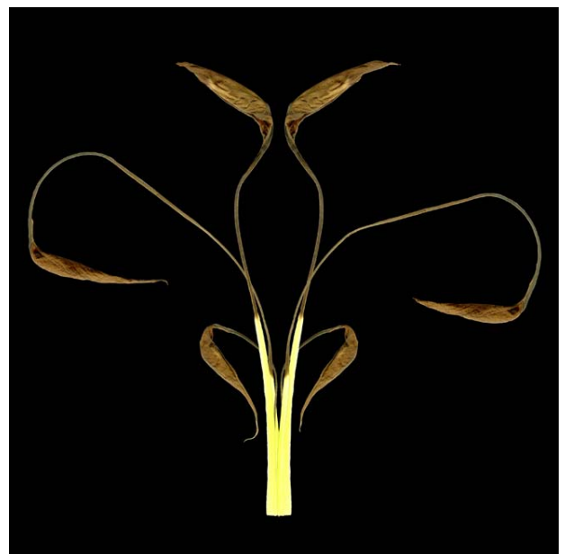
ESPECIE: Pensamiento no tan simétrico LUGAR DE RECOLECCIÓN: Una maceta de de mi casa.