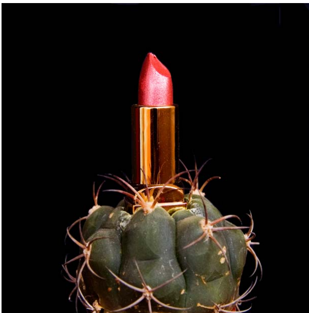
ESPECIE: Cactus erectus LUGAR DE RECOLECCIÓN: Albacete