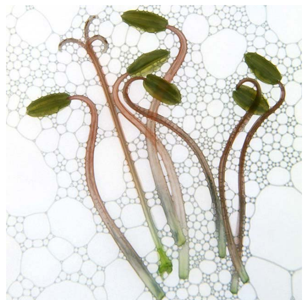
ESPECIE: Cautivos in vitro LUGAR DE RECOLECCIÓN: Tunquen (Chile)