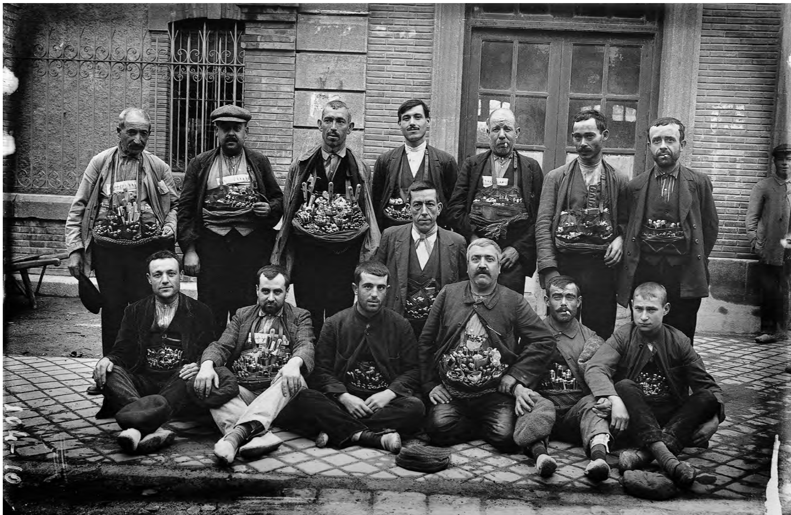
Cuchilleros de cinto en la antigua estación de ferrocarril de Albacete. Año 1923.