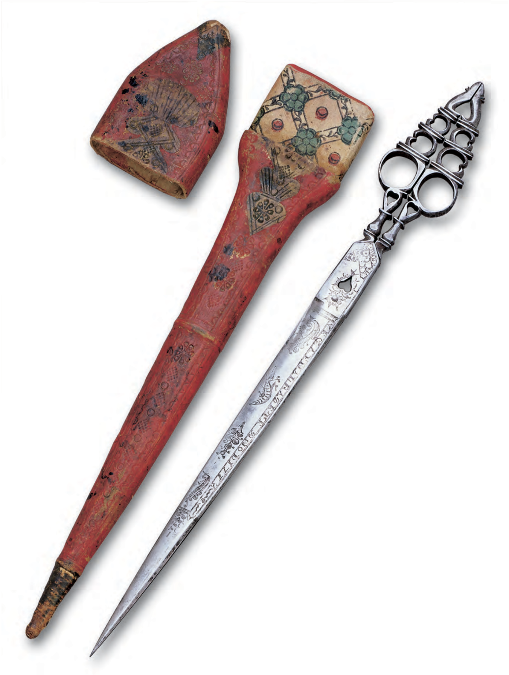
Tijera de escritorio con funda. Autor Vega. Albacete. Año 1778. Colección MCA.