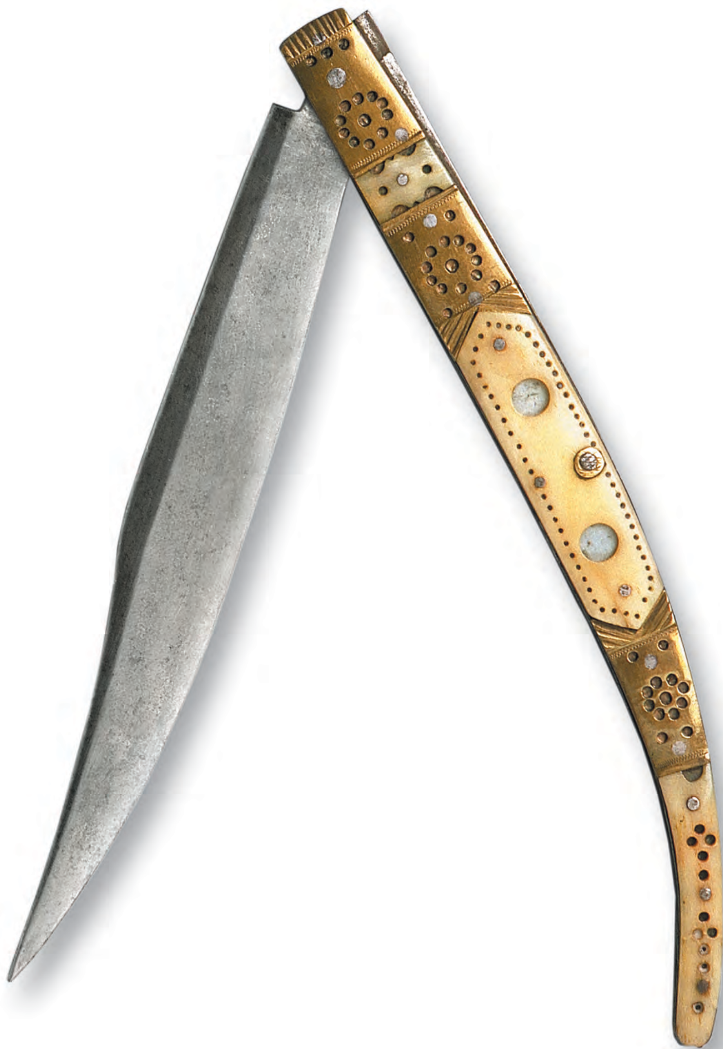
Navaja de espejillos. Albacete. Siglo XIX. Colección MCA.