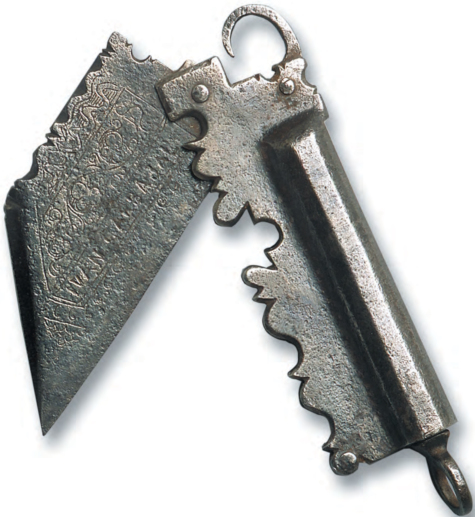
Navaja dinamómetro. Autor Iván Carbajal. Albacete. Siglo XVII. Colección Fundación CCM.