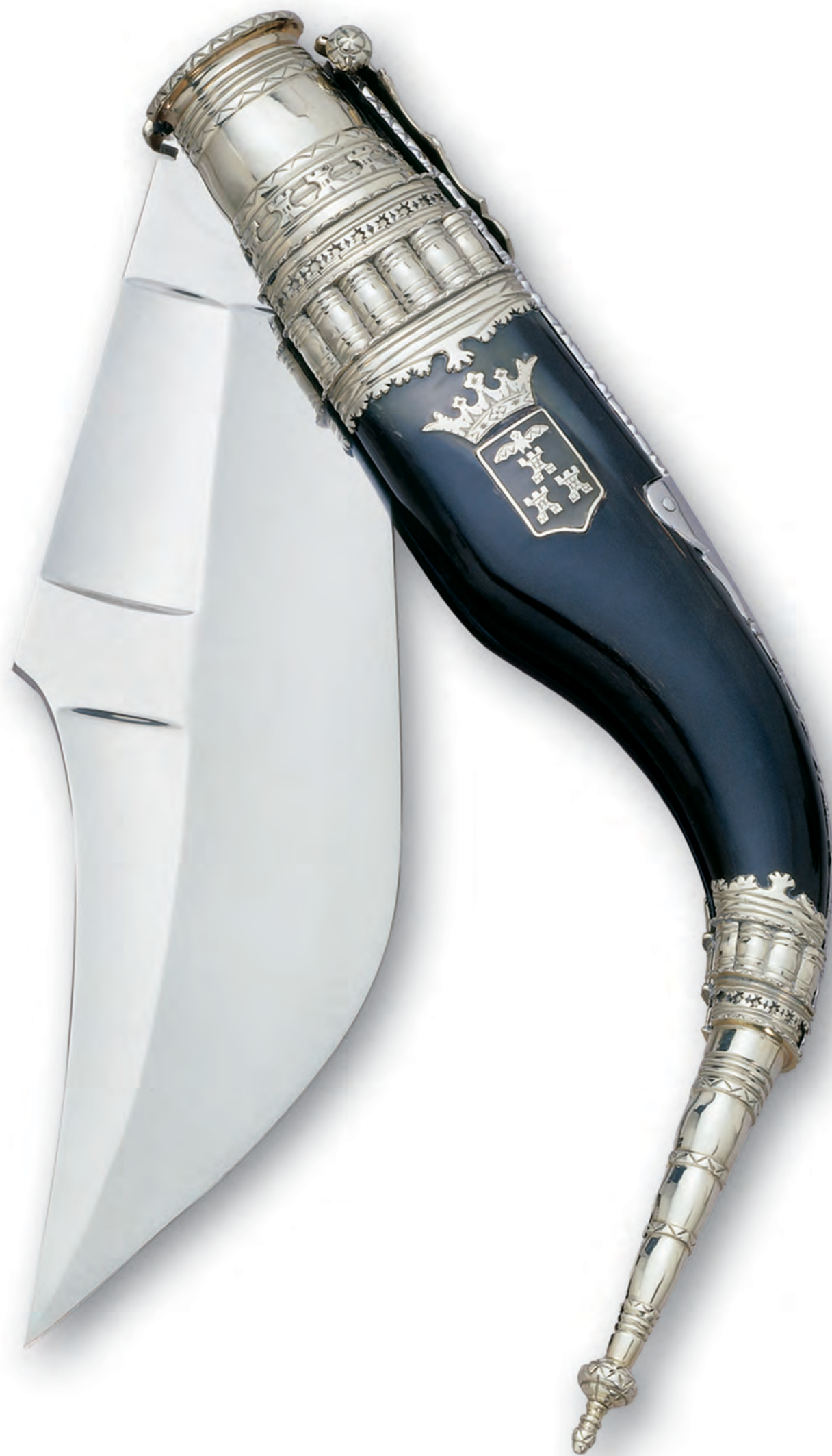
Navaja bandolera ancha. Autor José Giraldo Losa. Albacete. Año 1993. Colección APRECU.