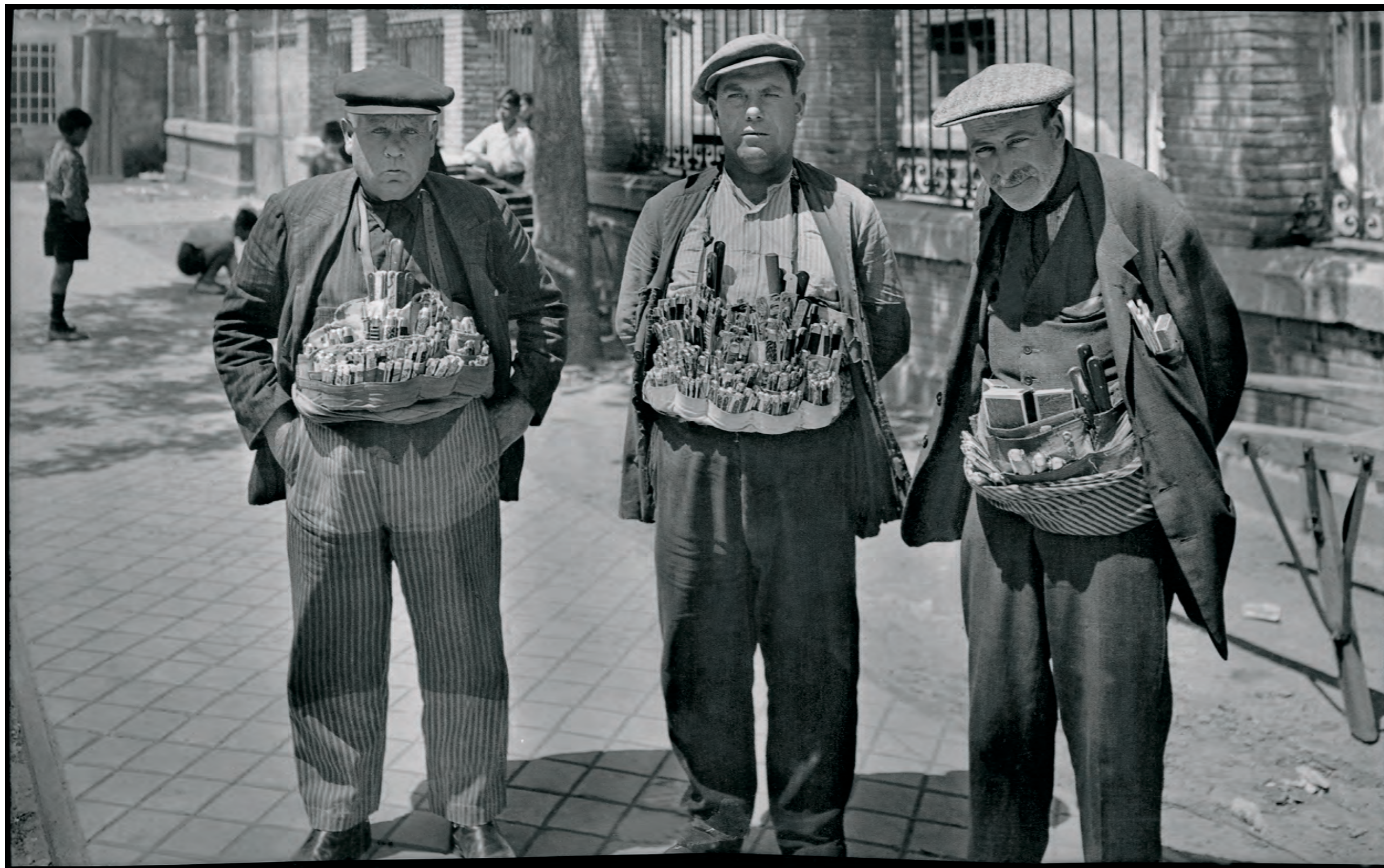
El Gazpacho, El Raco y El Tío Travillas.

Año 1930.