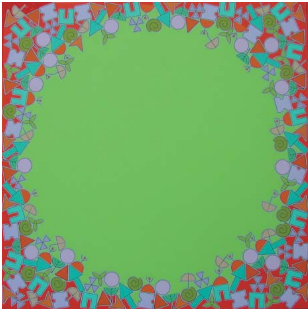
2005: acrílico sobre lienzo 125 x 125 cm.