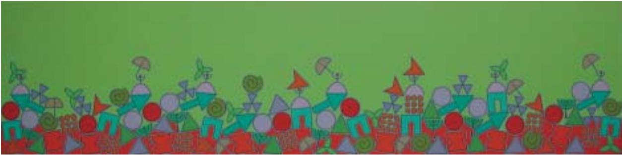
2005: acrílico sobre lienzo 200 x 50 cm.