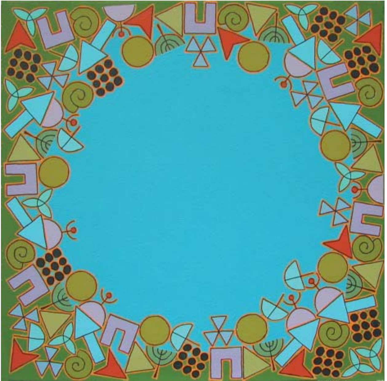
2004: acrílico sobre lienzo 50 x 50 cm.