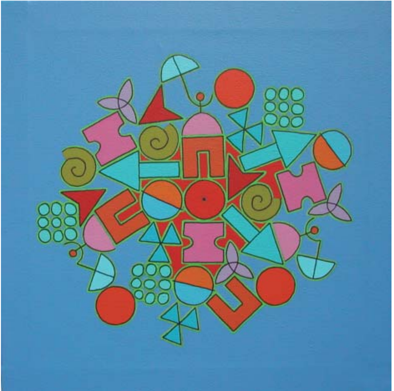
2005: acrílico sobre lienzo 40 x 40 cm.