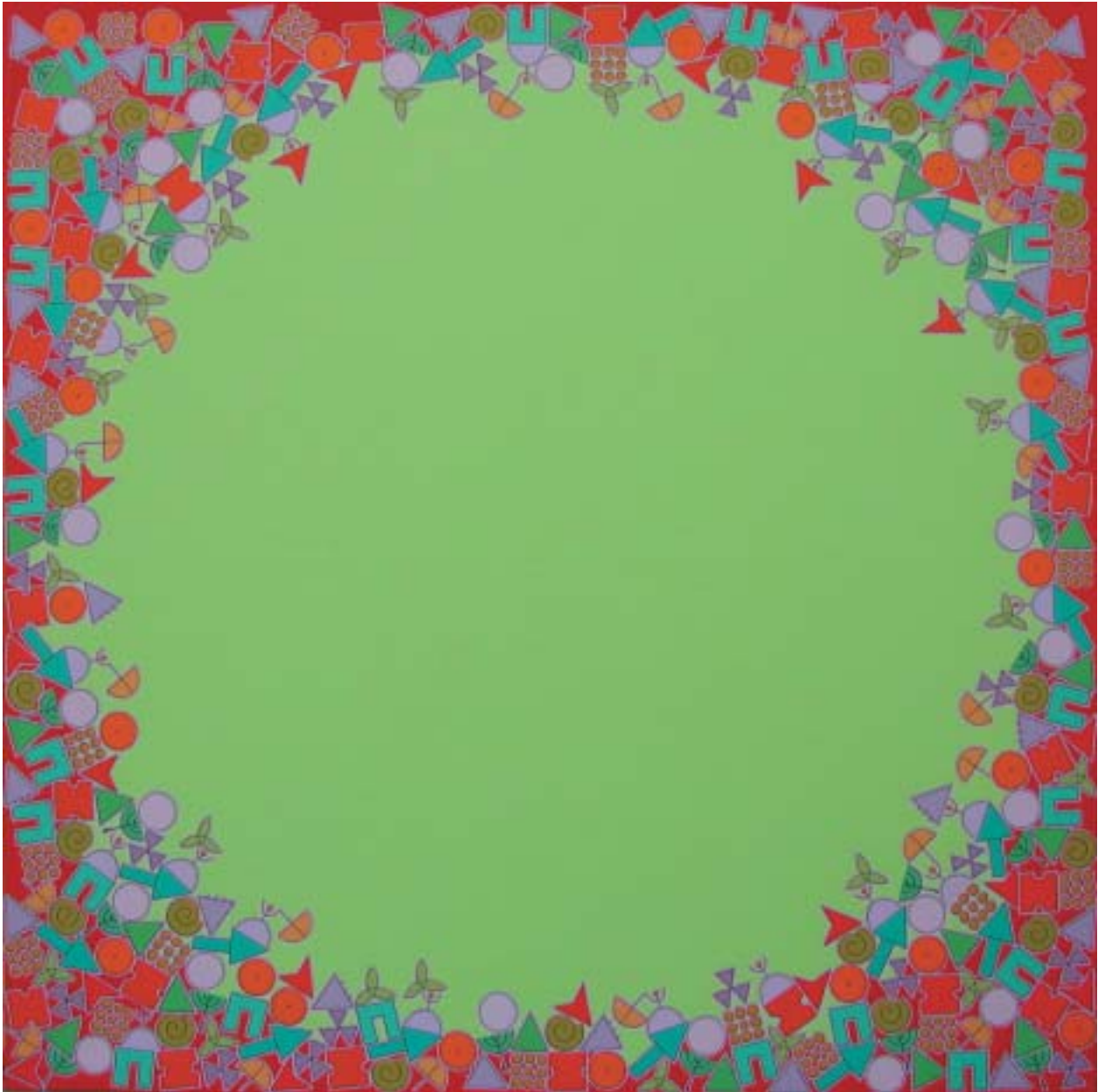
2005: acrílico sobre lienzo 175 x 175 cm.