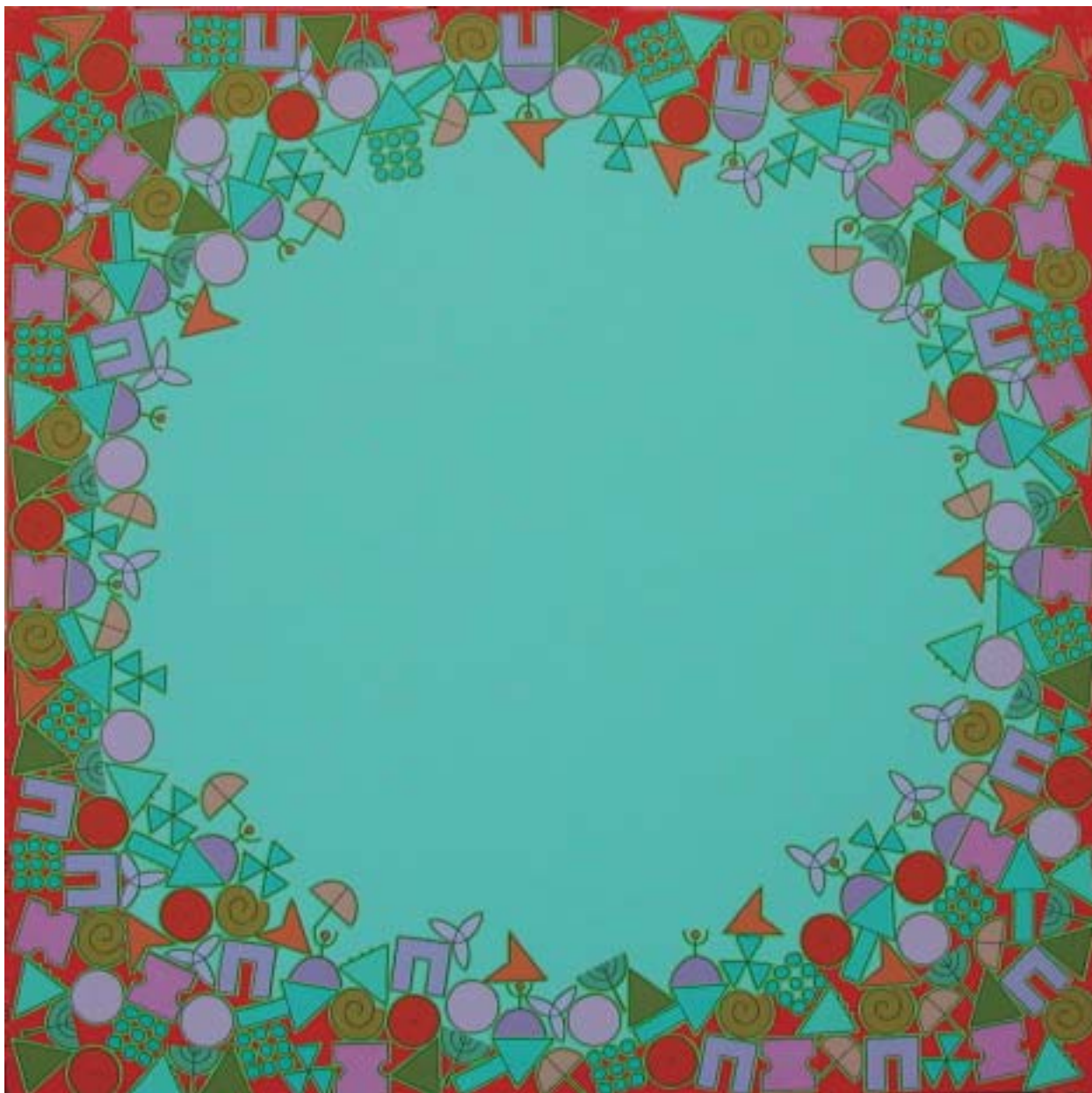
2005: acrílico sobre lienzo 125 x 125 cm.