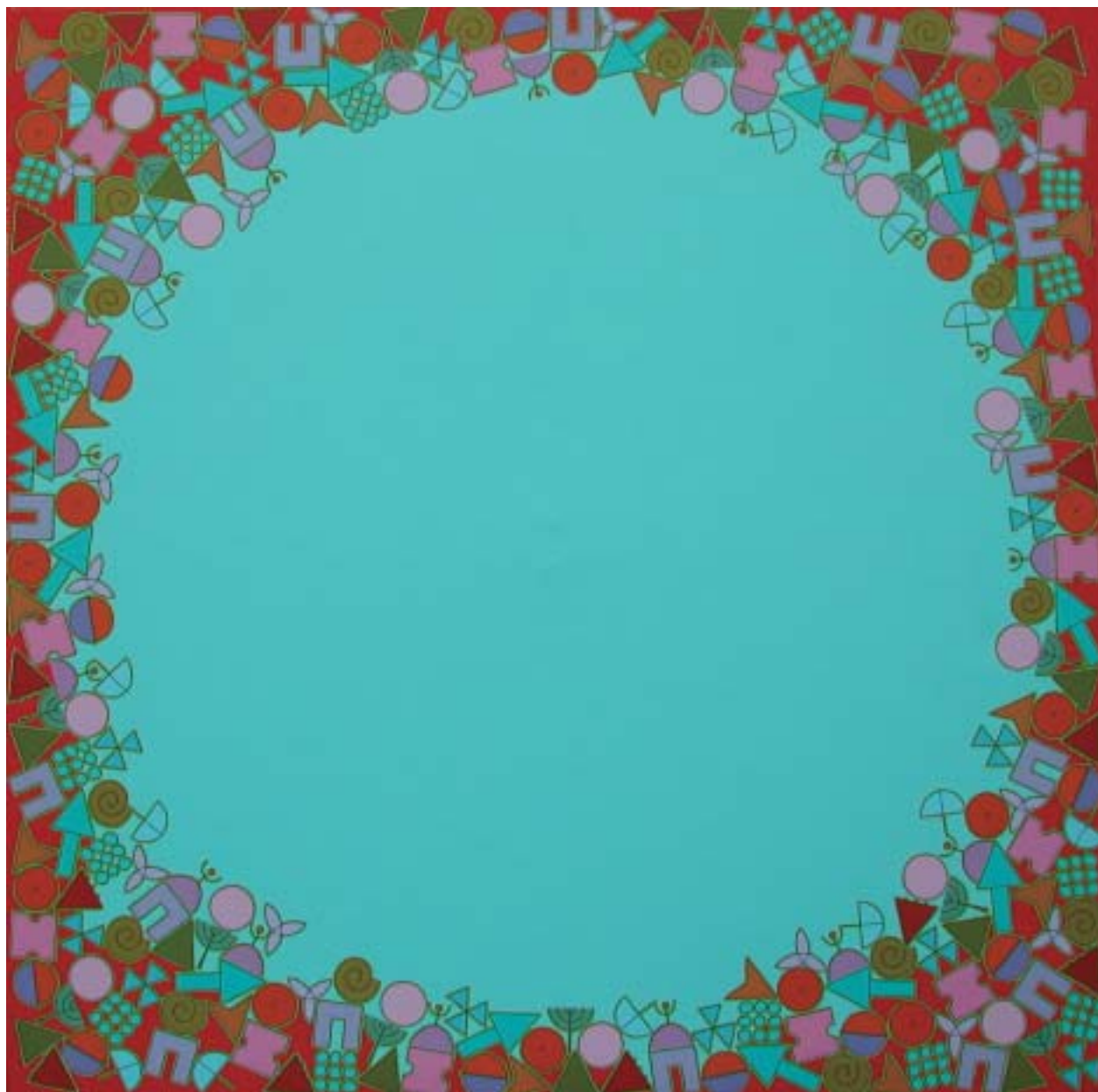
2005: acrílico sobre lienzo 150 x 150 cm.