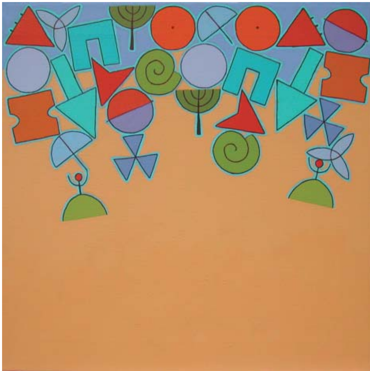
2004: acrílico sobre lienzo 50 x 50 cm.