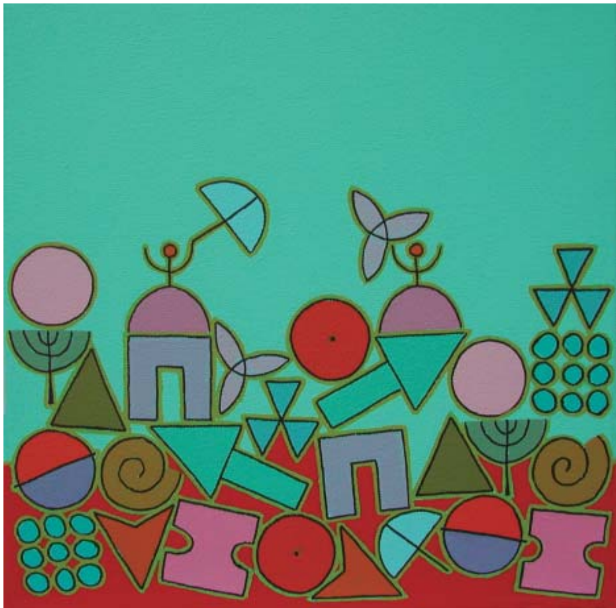
2005: acrílico sobre lienzo 30 x 30 cm.