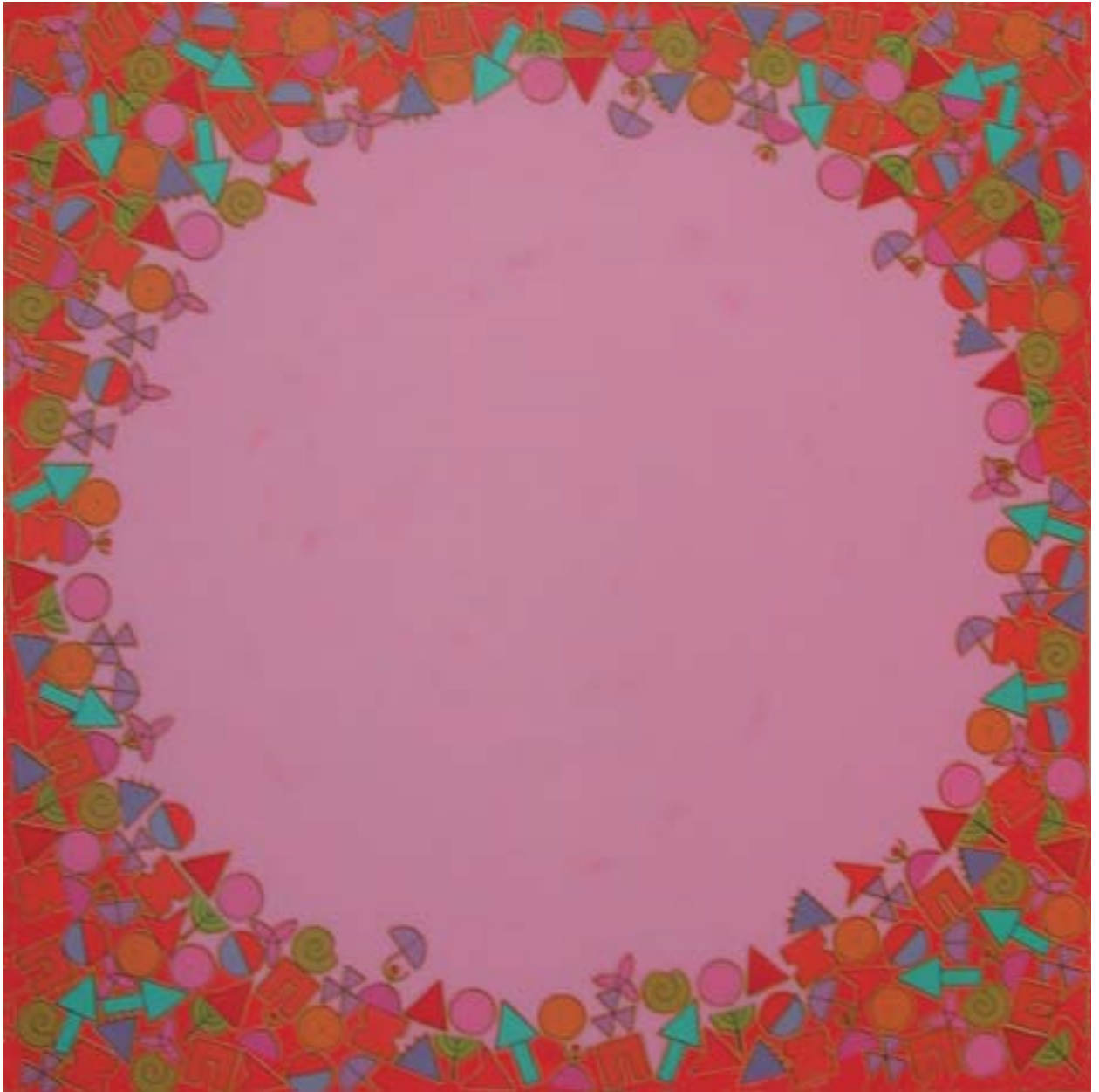
2003: acrílico sobre lienzo 150 x 150 cm.