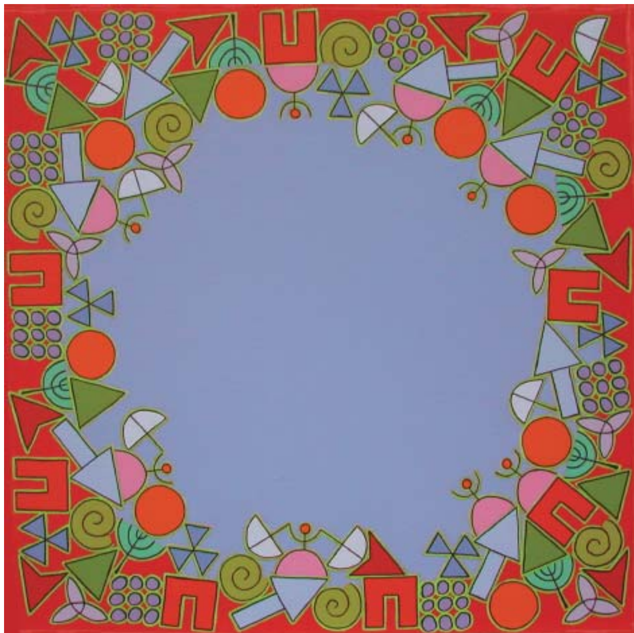
2003: acrílico sobre lienzo 40 x 40 cm.