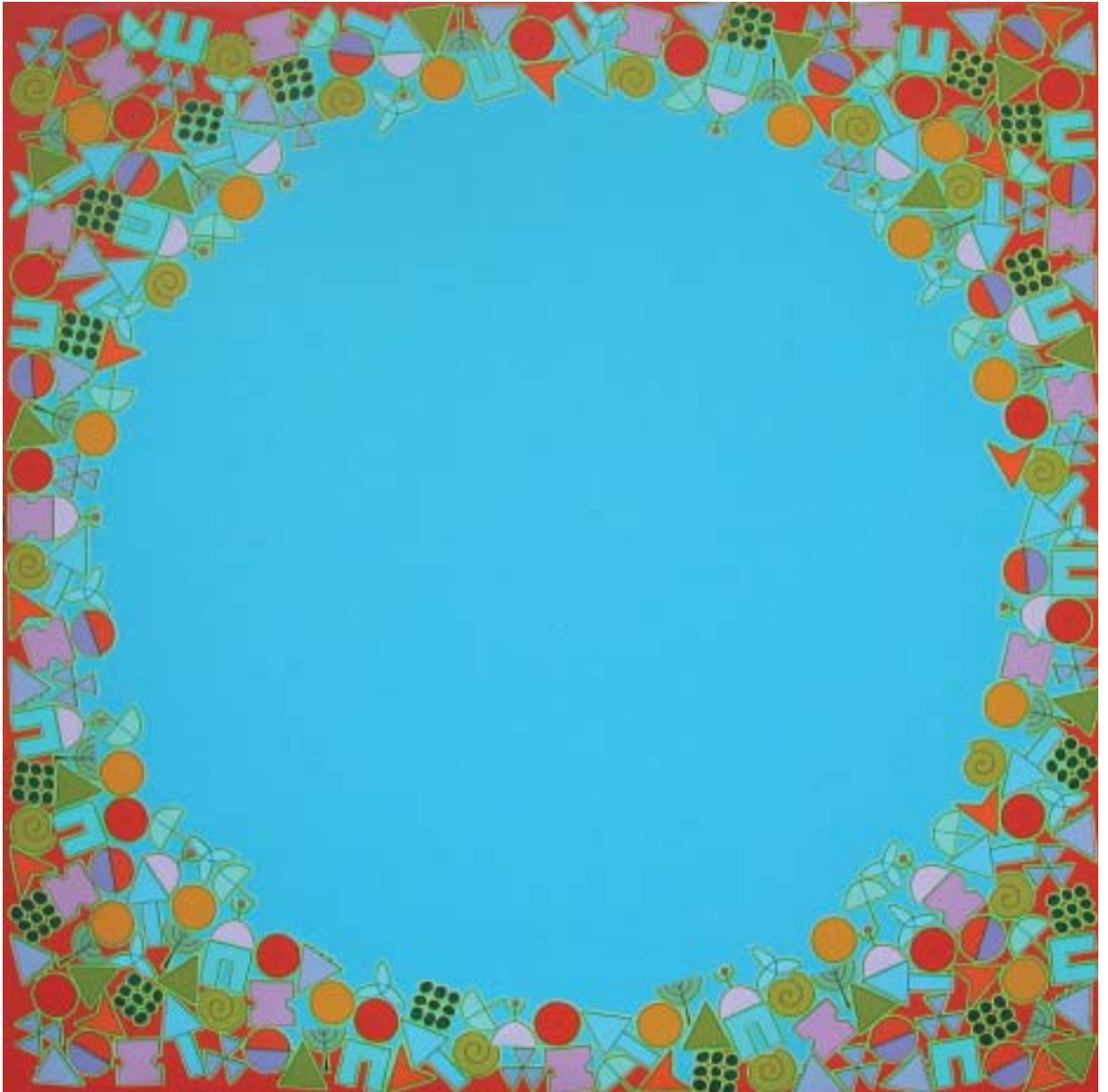
2005: acrílico sobre lienzo 150 x 150 cm.