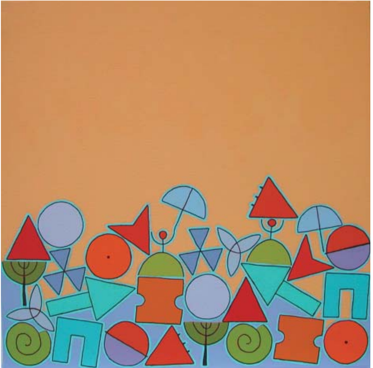
2004: acrílico sobre lienzo 50 x 50 cm.