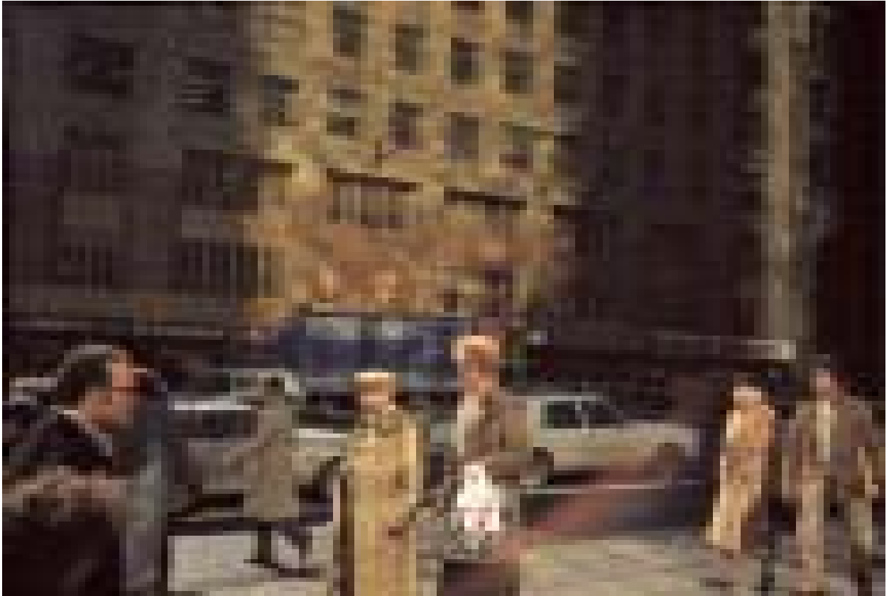
New York, 1986