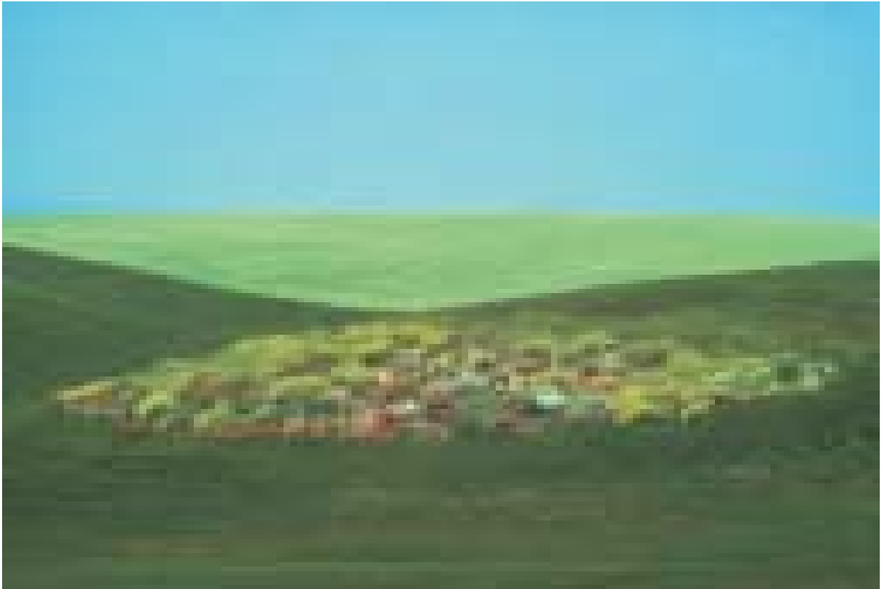
Basilicata, Italia, 1975