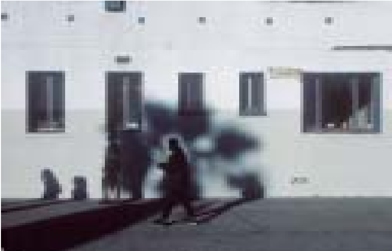
Venice, Los Angeles, 1999