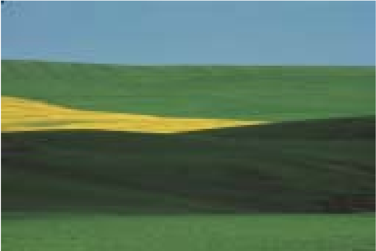
Basilicata, Italia, 1995