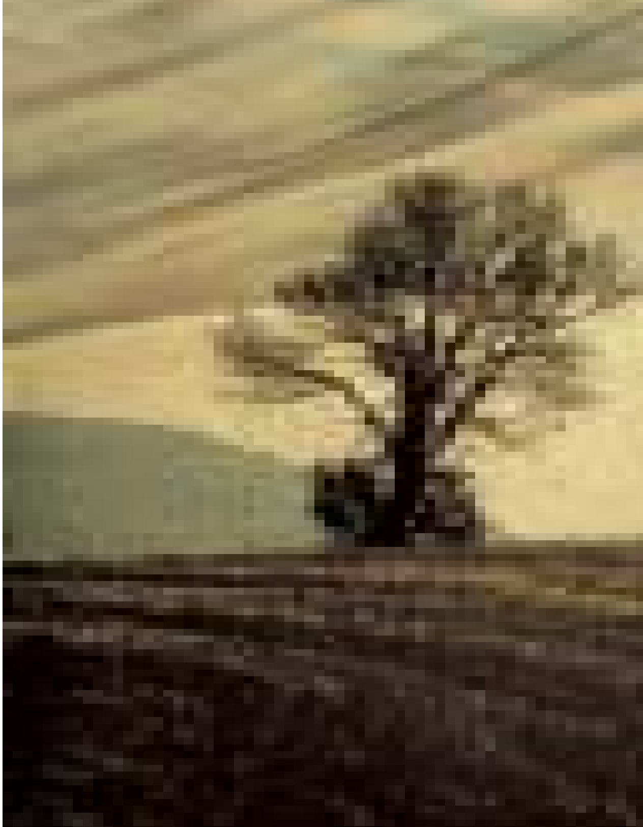
Basilicata, Italia, 1987