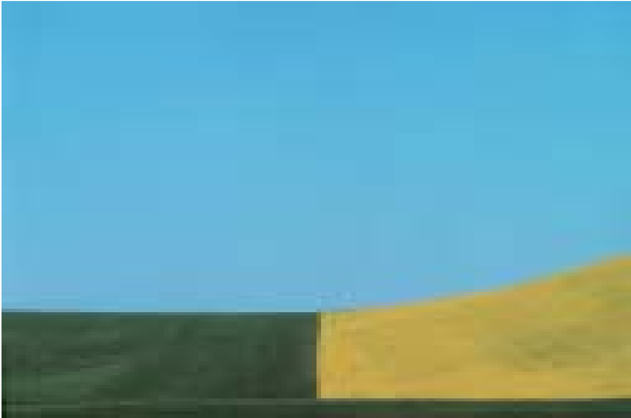
Basilicata, Italia, 1975