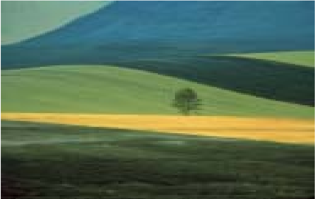
Basilicata, Italia, 1978