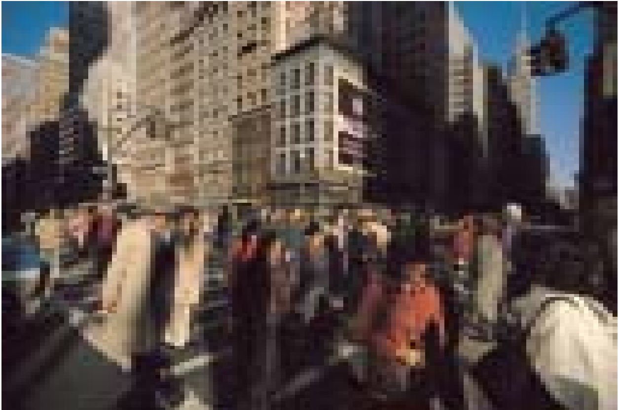
New York, 1986