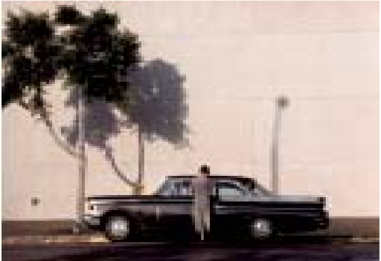
Los Angeles, 1991