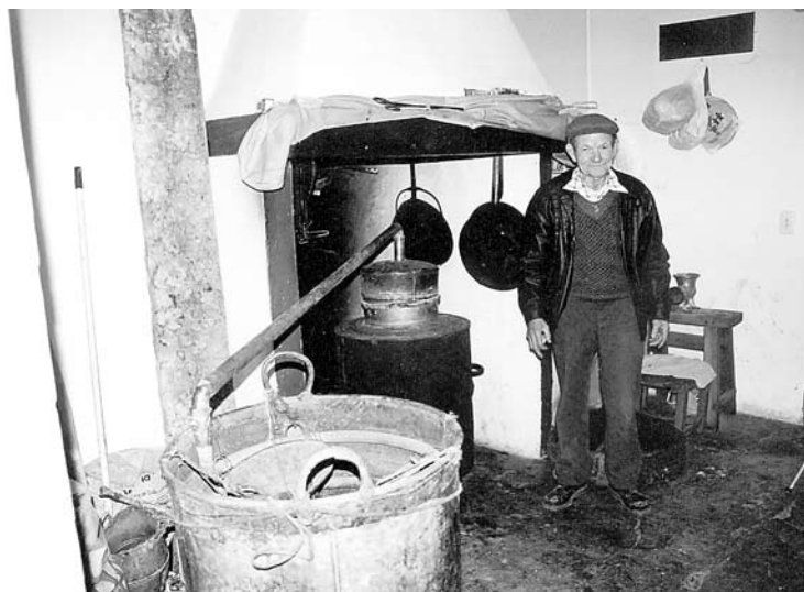
Alambique de hacer aguardiente