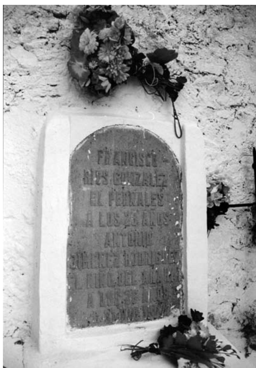
Tumba del Pernaes

Ya mataron a Pernaes, ladrón de Andalucía, ¡el que a los ricos robaba y a los pobres socorría!