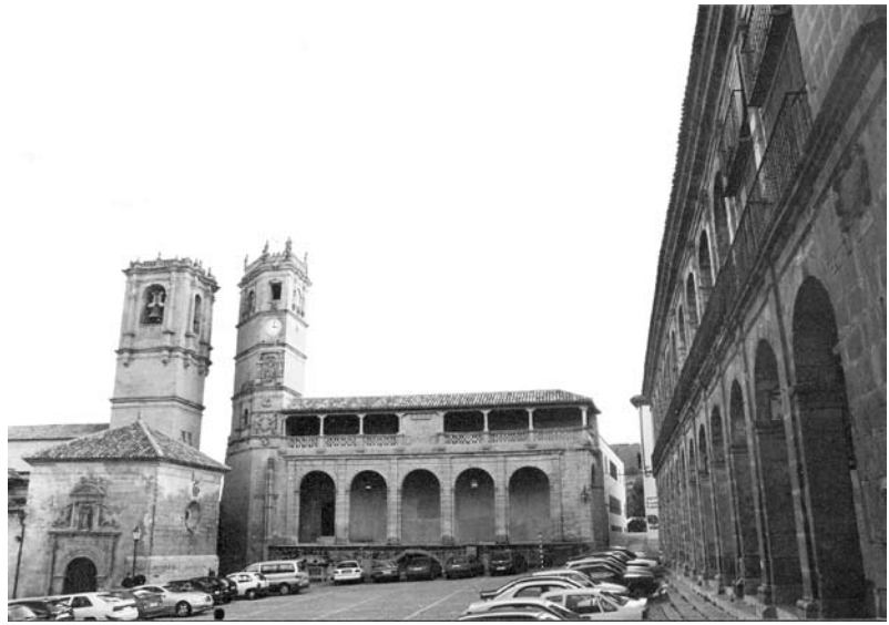
Plaza Mayor de Alcaraz

En esas arrugas de decadencia Alcaraz nos