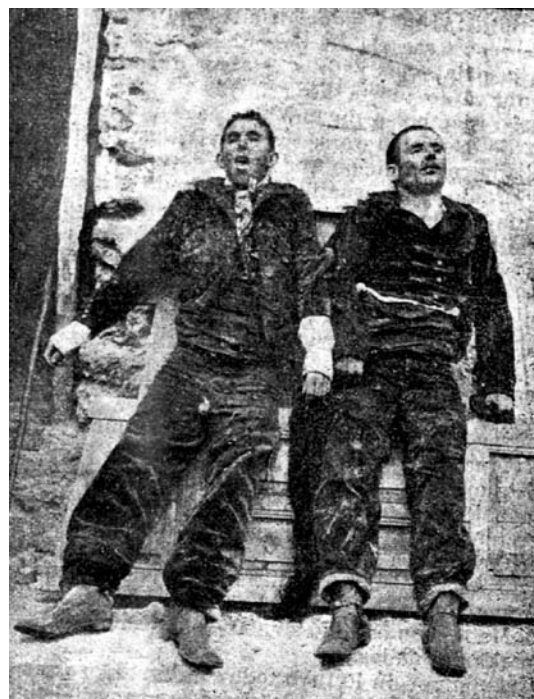
Pinales y el Niño muertos

“Al Niño de Arahal se le ocupó una yegua castaña clara, crines entrecortadas, en la tabla izquierda del cuello un hierro que parece una S; rozadura en el cuello izquierdo; pelo blanco por el costillar izquierdo; unas rozaduras en la parte superior del mismo costillar; ligeras rozaduras en la parte superior del costillar derecho; en ambos ijares y parte baja del vientre, señas de castigo con espuelas; en el anca izquierda, otro hierro como el del cuello; cola cortada por la proximidad del Maxle, herrada y cerrada, siete cuartas y dos dedos; una canana con 30 cartuchos con bala, y 19, además, que llevaba en el bolsillo de la chaqueta, metidos en un saquito de tela; un revólver sistema Smith, número 9, cargado con cinco cápsulas vacías; una cadena de reloj, al parecer de plata, con un guardapelo; una navaja de muelles de grandes dimensiones, fabricada en Albacete; una petaca de vaqueta basta color avellana y labores blancas; una fosforera de latón encarnada, destrozada por un proyectil; un peine blanco; una funda de revólver con un cinturón, todo de cuero color avellana, con un botón dorado. El aparejo se