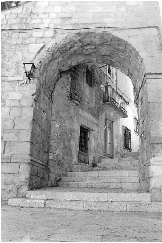
Arco de Zapatería, Alcaraz

ramente esplendorosos, lugares de placer, calma y sosiego, lejos del mundanal ruido de la ciudad. Así la definía el gran autor alcaraceño Roberto Molina nacido a finales del siglo XIX: