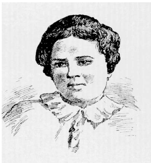
Conchilla la del PERNALES

Se cuenta que estos tres pueblos celebraban juntos la procesión de Semana Santa, pero como no tenían suficientes pasos suplían las imágenes santas por las personas de mejor conducta social. Especial relevancia tenía la figura de Jesús, por lo que habría de ser el hombre más honrado de todos los elegidos. Cierta año salió la procesión por las calles de Marinaleda, con el intérprete del Redentor a la cabeza, vestido con su túnica morada, la corona de espinas y la cruz sobre el hombro, que le había sido atada para mayor seguridad. Todo marchaba tranquilamente, con el acostumbrado fervor que se manifiesta en estos actos, hasta que al doblar una esquina apareció la pareja de la Guardia Civil. Ver los tricornios el Nazareno y salir corriendo de la procesión fue todo uno, aunque el peso de la cruz le impidió escapar de los guardias, que extrañados de su huída lo capturaron y lo llevaron al cuartelillo. Más tarde se supo que el supuesto Jesús estaba reclamado por varios delitos de robo, aunque con todo ello