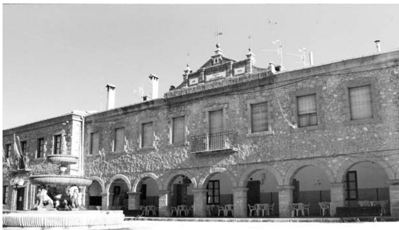
Plaza de Luis Escudero, Riópar

Para protegerse de las brujas los serranos colocaban las tenazas