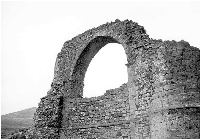
Acueducto de Alcaraz

Desde este santuario de Cortes queda situada a tiro de piedra Alcaraz, aunque en medio se encuentra el cerro de la Atalaya, donde dicen que hubo en tiempos antiguos una pequeña fortificación sarracena. Lo primero que destaca de esta población es el viejo y ruinoso castillo en lo alto del pueblo, del que