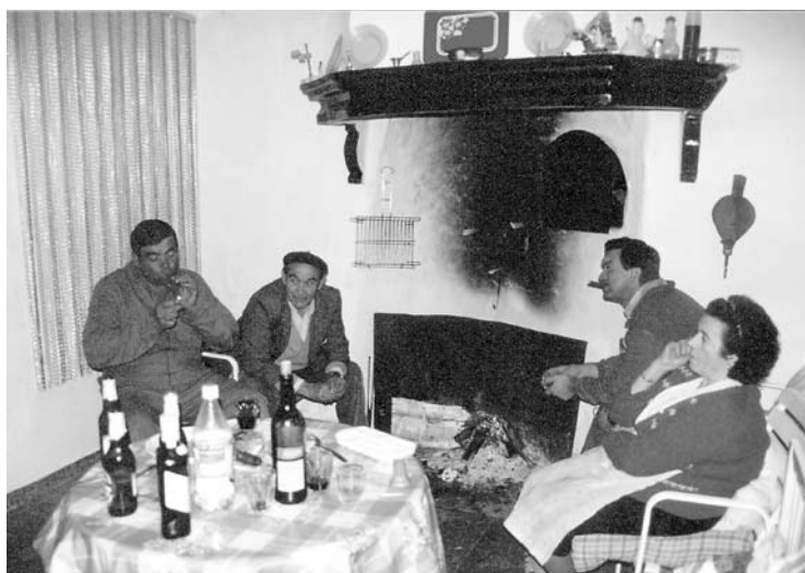
Cortijo del Ojuelo