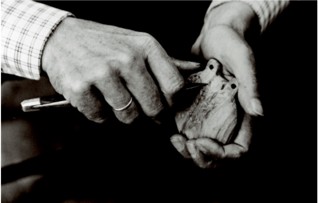
Consuelo López Moreno Instrumentos tradicionales: Castañuelas Accésit Colección Completa. Año 2001