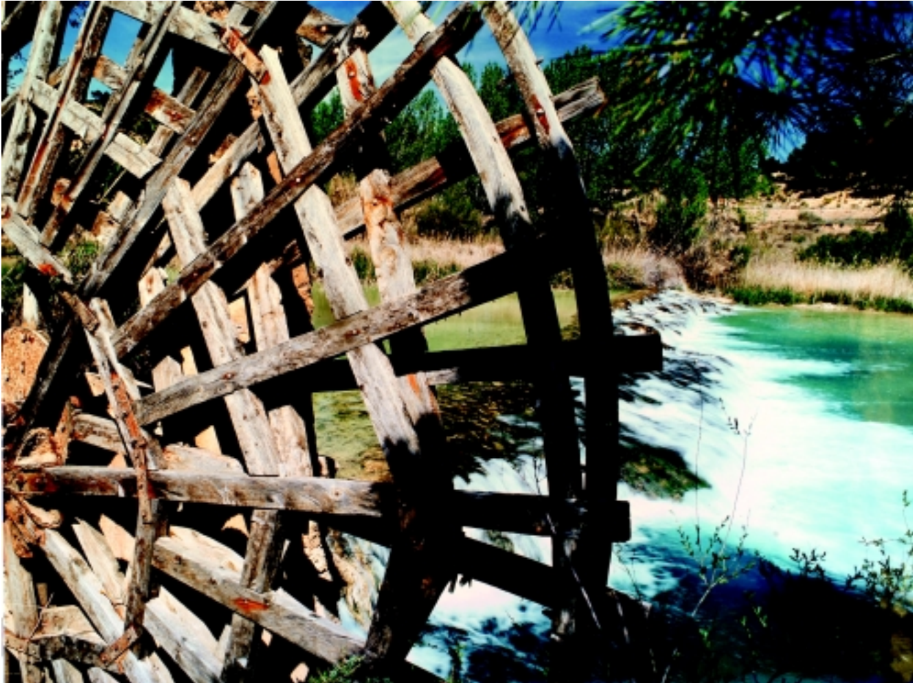
Antonio Real Hurtado Agua: usos y costumbres. Foto de la noria Accésit Colección. Año 2002