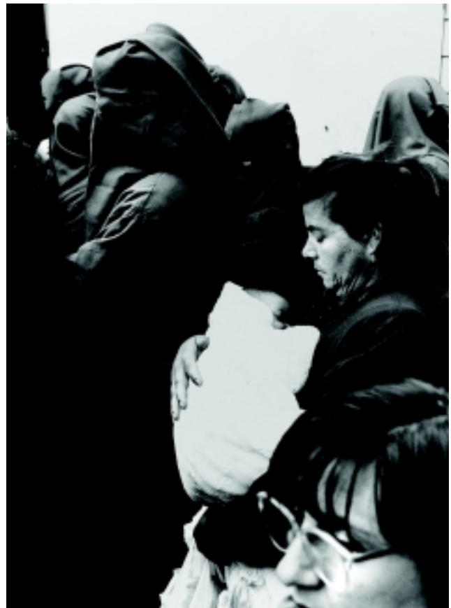
Diego Gómez Sánchez Estampas de la Semana Santa de Tobarra Seleccionado Blanco y Negro. Año 1996