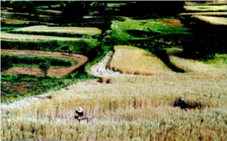
Antonio Real Hurtado Trabajos rurales Accésit Color. Año 2001