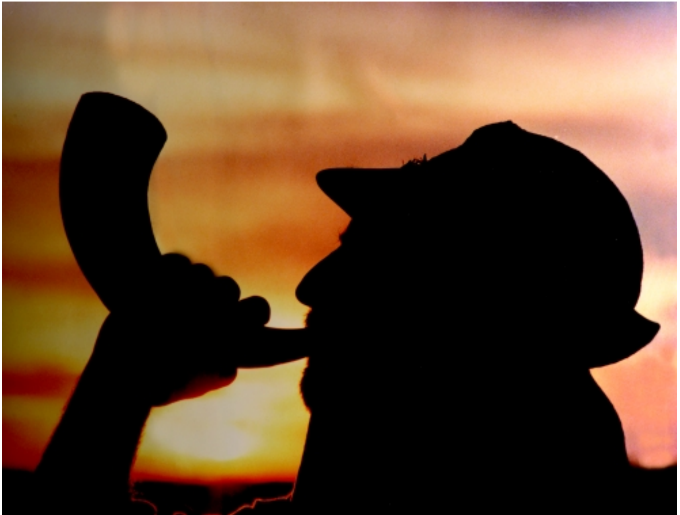
Asociación Az-Za'faran Segaor Accésit Color. Año 2001