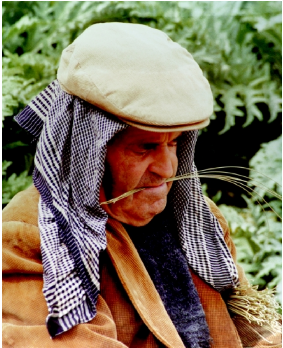
Asociación Az-Za'faran Posetes Premio Colección Completa. Año 2000