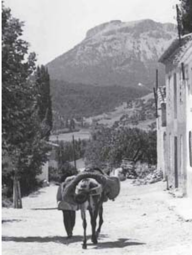
Con el SERÓN cargado