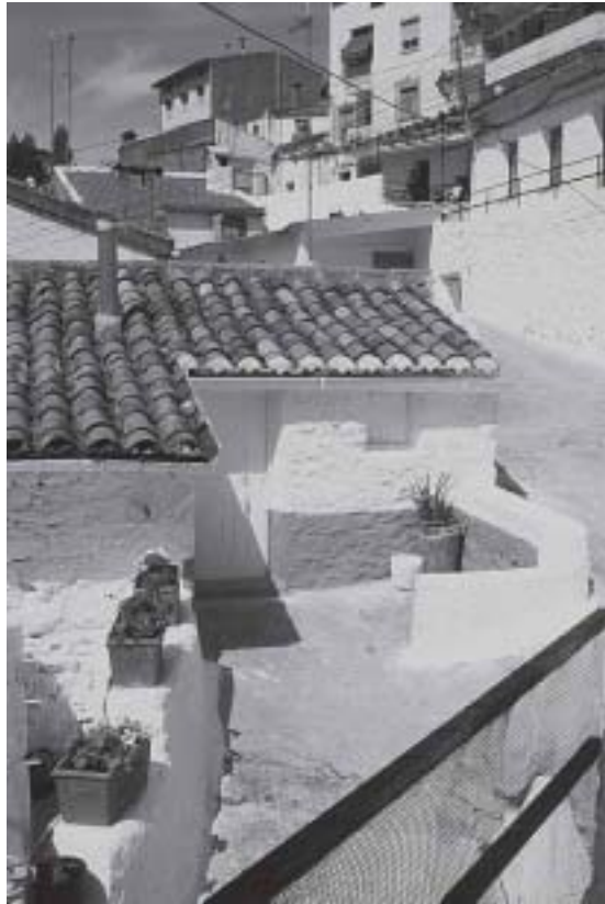
Calle de Casa NOGUERA