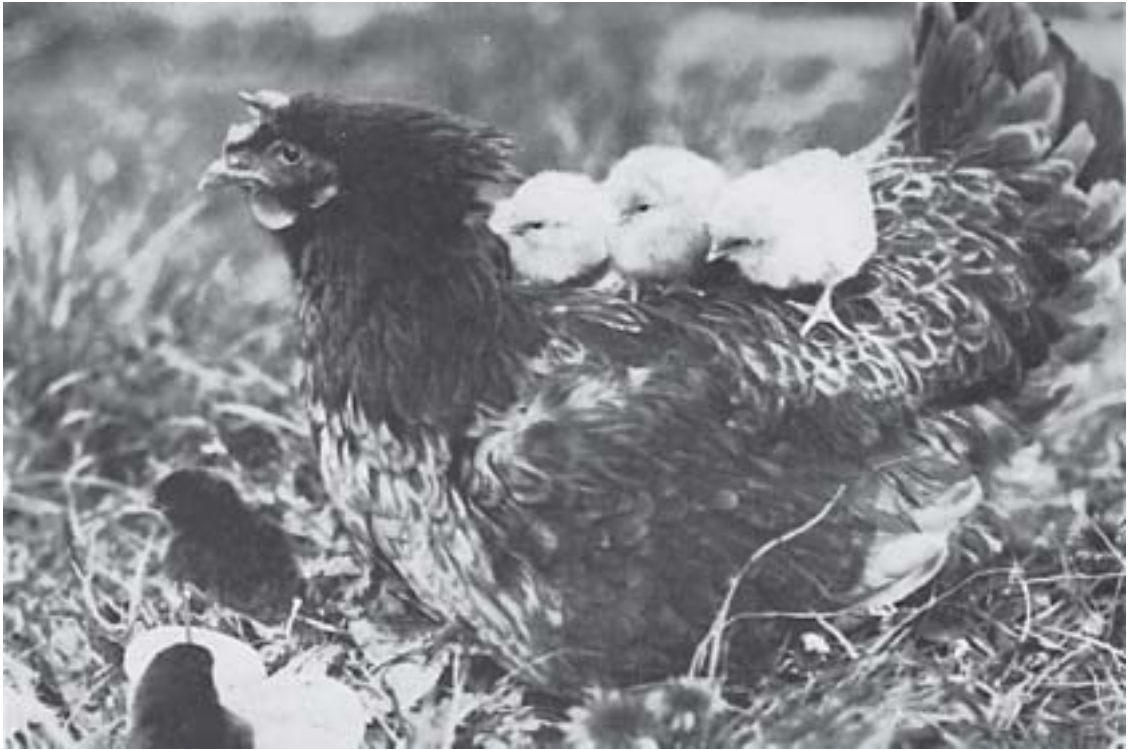
LLUECA con polluelos