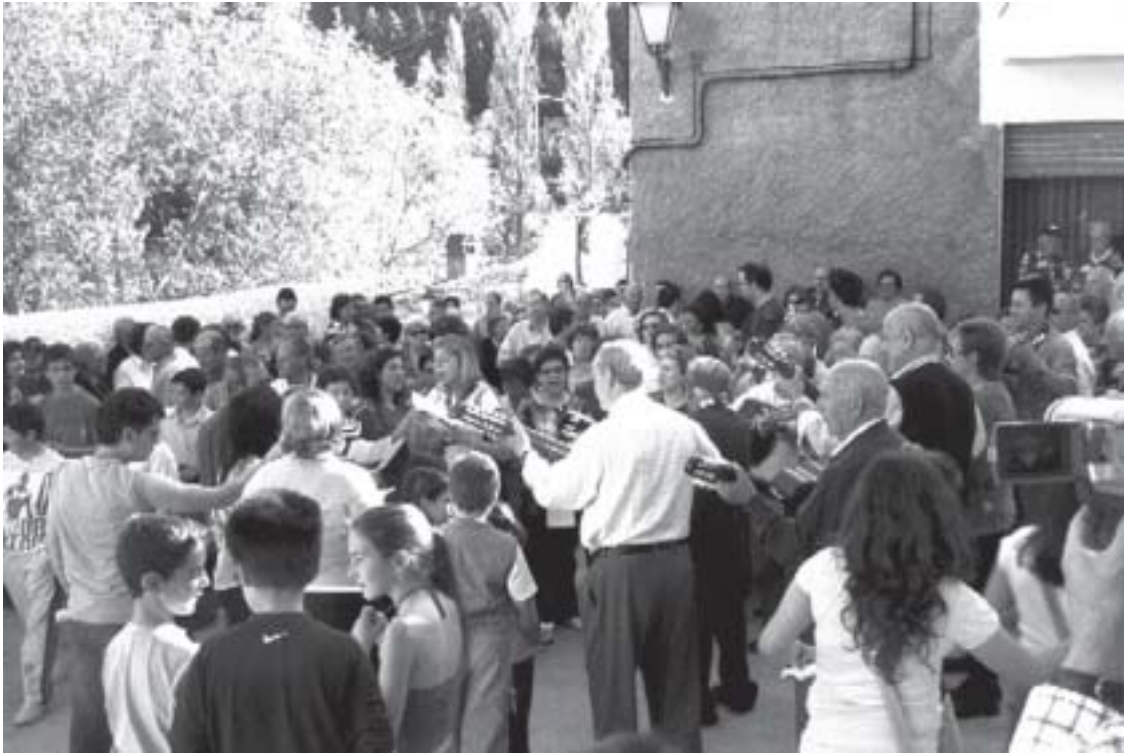
Cantando Mayos y FOLÍAS