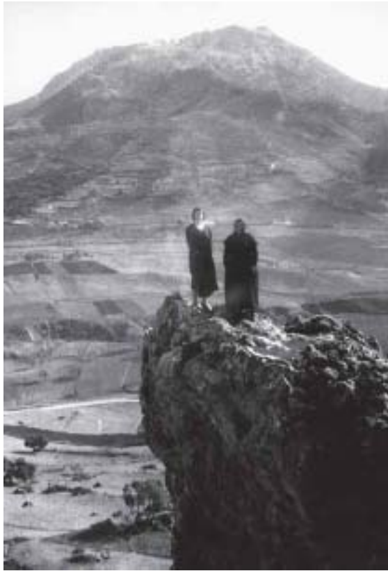
Engarabitadas por esos GARITOS