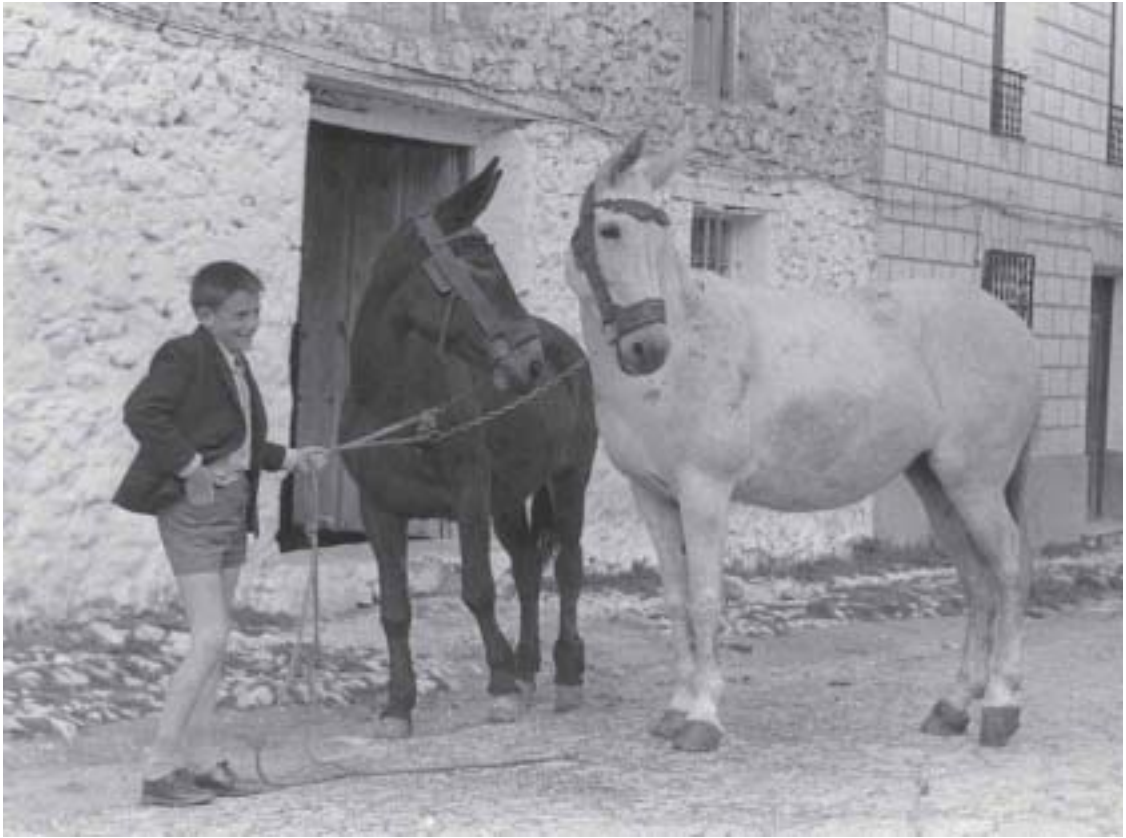
Los MACHOS del ramal