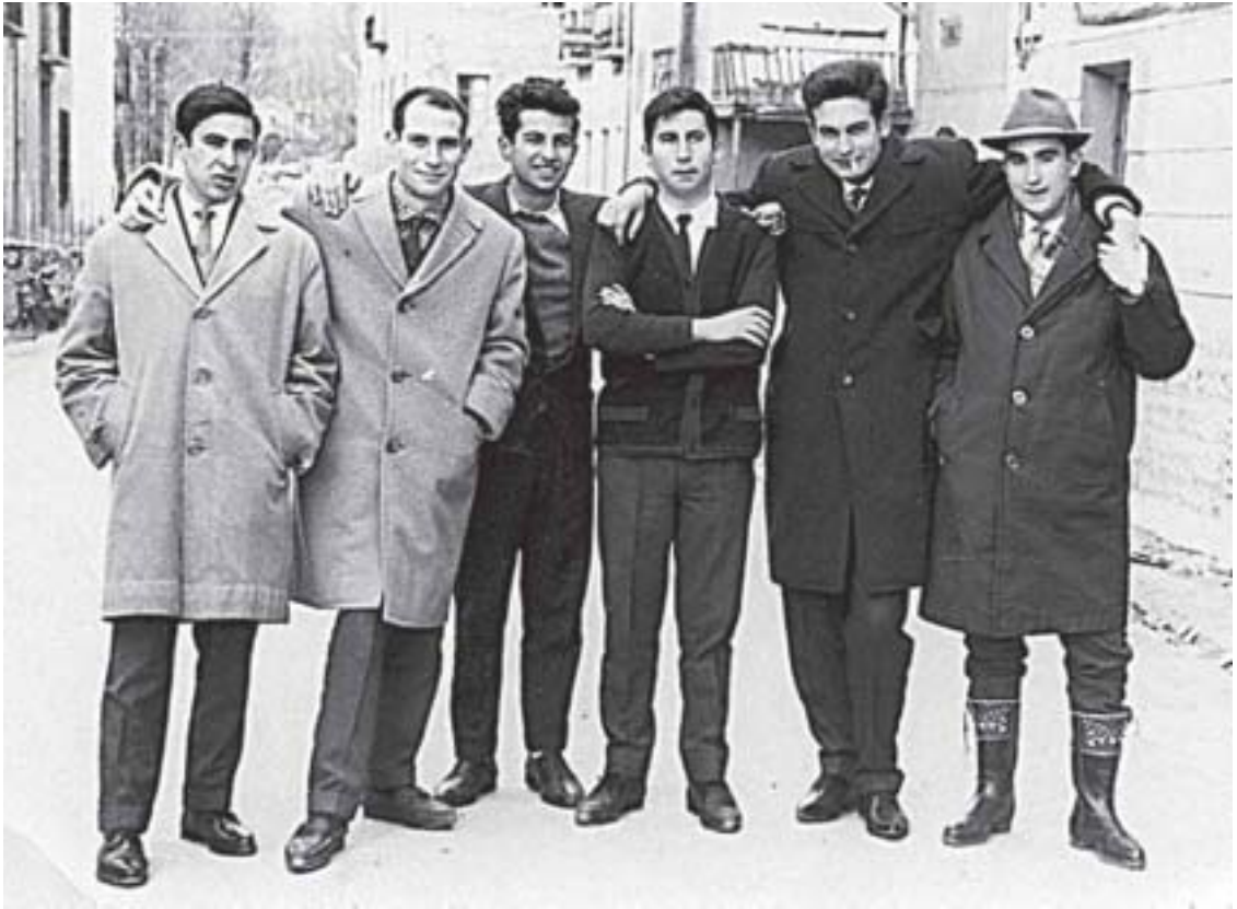
ZAGALUCHOS de paseo