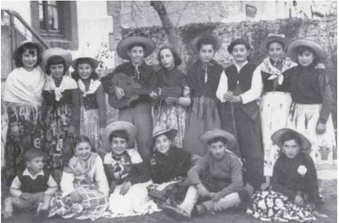
AGUILANDEROS en el jardín de Casa Nueva