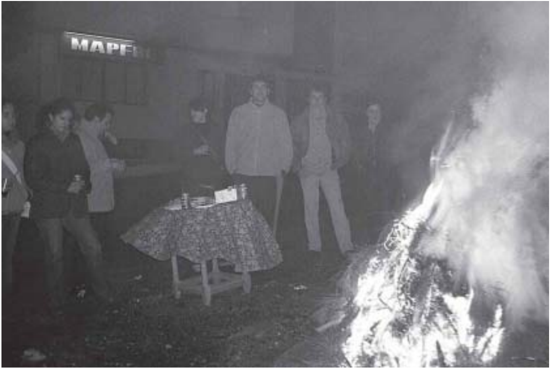
Junto a la LUMINARIA