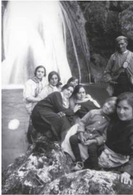
JIRA a Los Chorros