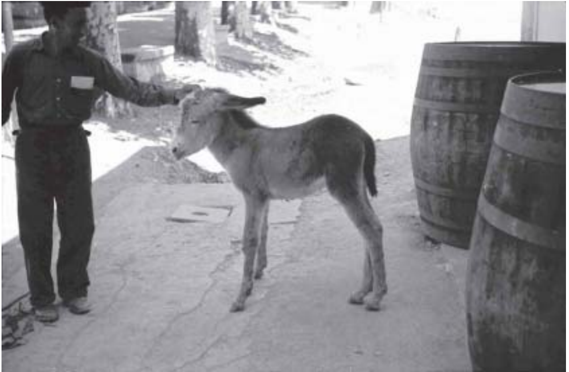
BURRUCHO y Ugenio