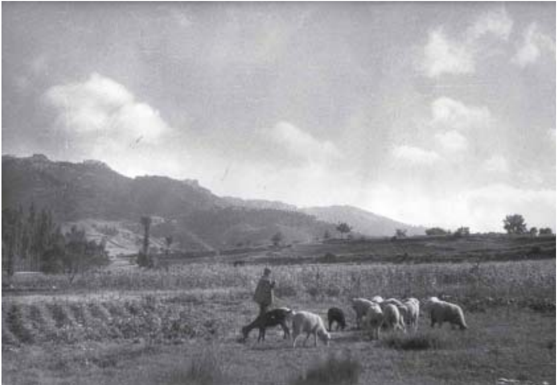
El pastor con los OVEJOS