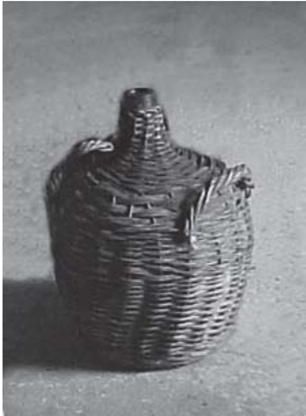
Una DAMAJUANA de zorra