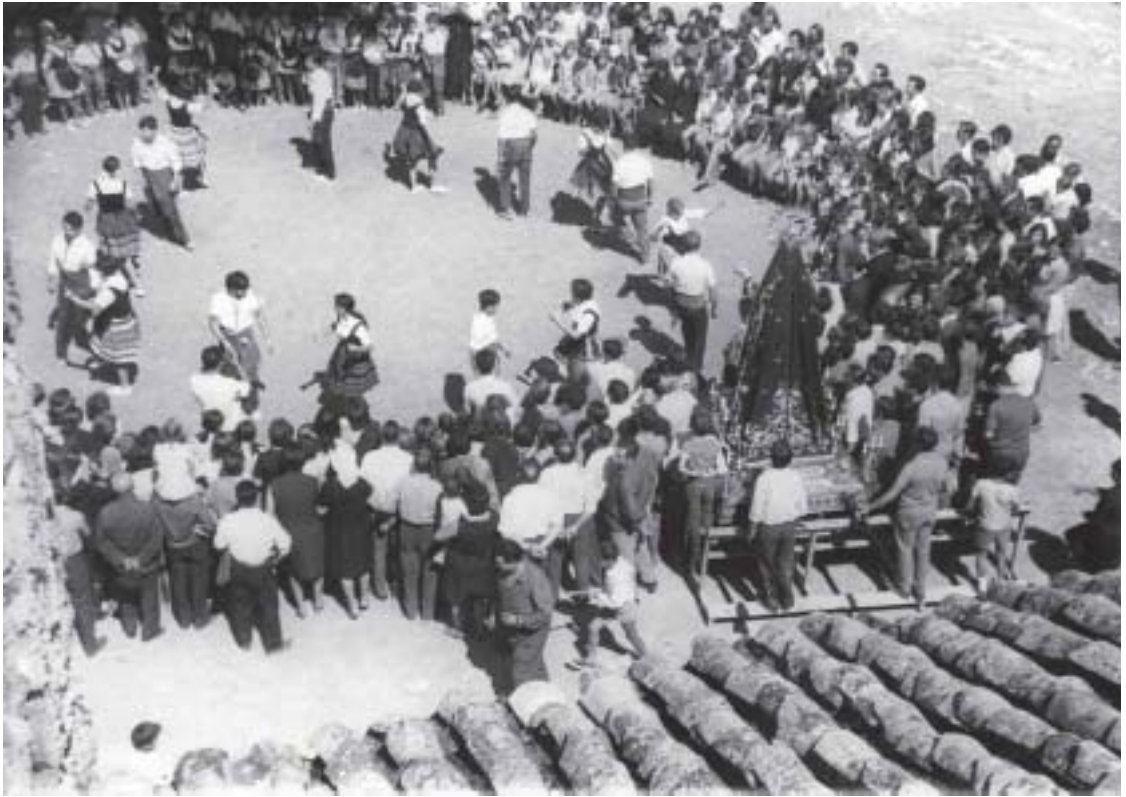
Bailando la PITA