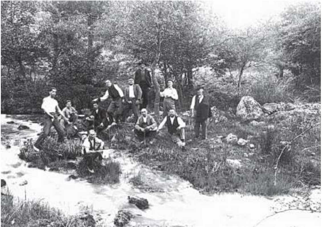
El día de San Juan en el ROYO el Molino