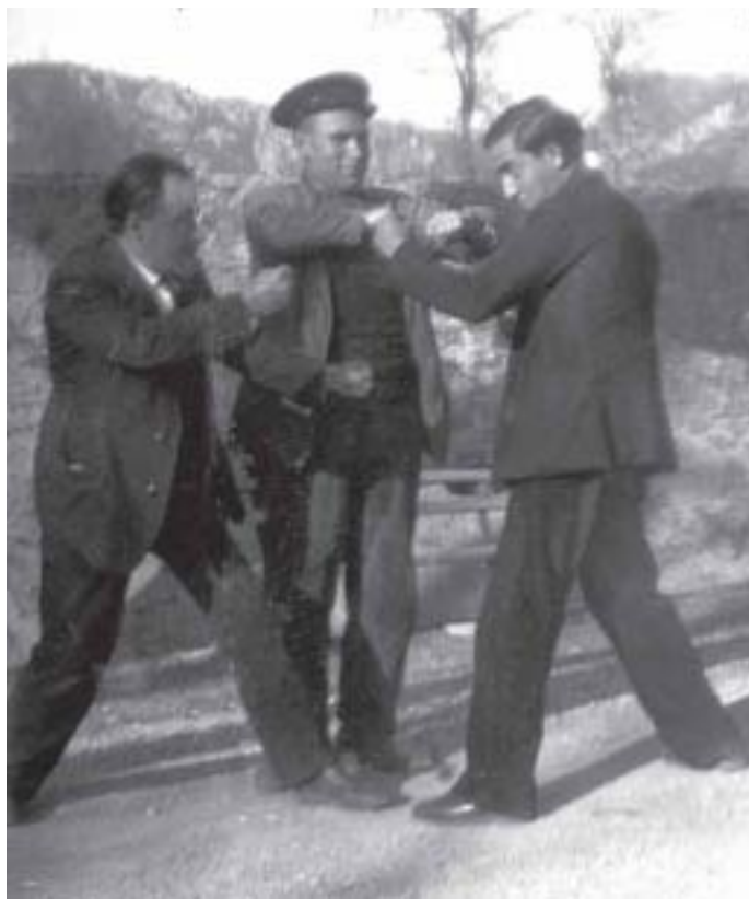
Boxeando pero sin INTERRIÑA