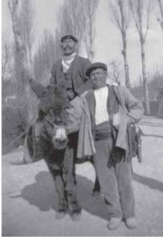
El CHALÁN vende la burra