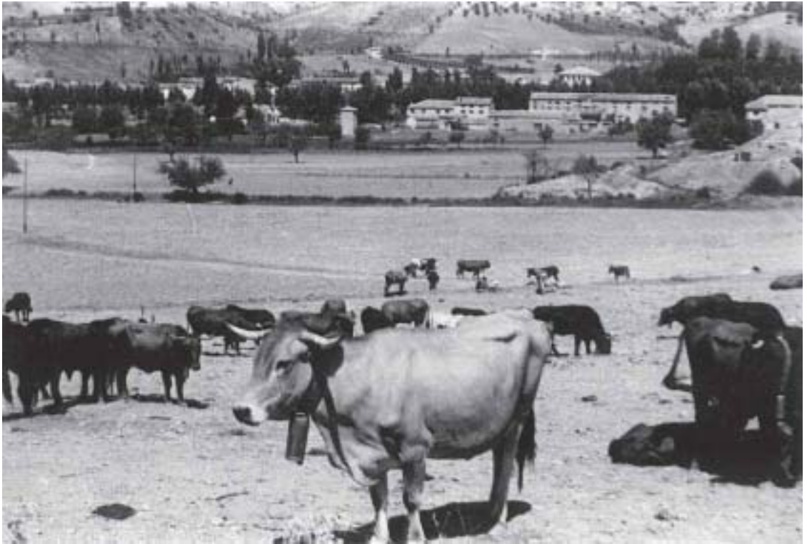
La CUERDA en el Collao de la Era