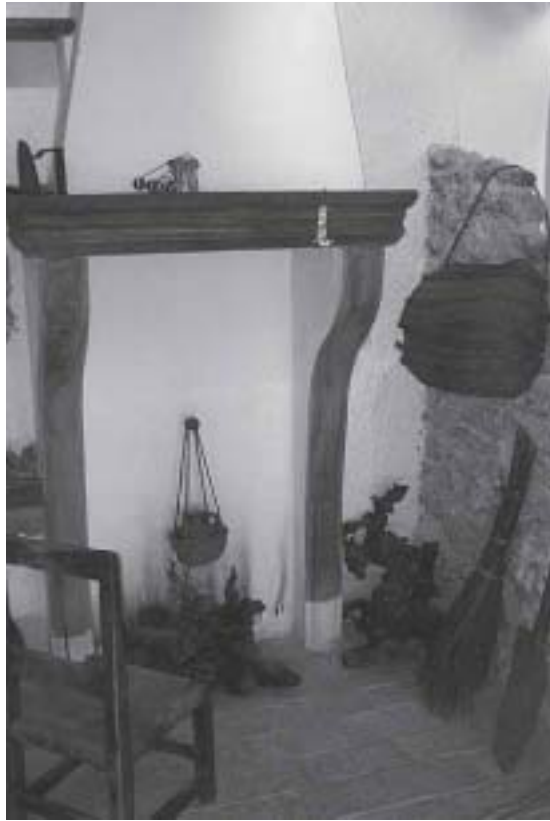
HUMERO recién blanqueado